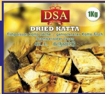
DSA 1Kg DRIED KATTA fishpoisson katta séché / getrockneter Katta-Fisch Scomberoides lysan கட்ட கருவாடு

இலங்கை மூல்கடலில் பிடிக்கப்படும் சிறந்த சுகாதார முறையில் தயாரிக்கப்படும் ஜிரோரப்பிய தரசான்ந்தமூடன் இறக்குமதி செய்யப்பட்ட தரமான கருவாடுகளை எம்.டிடம் பெற்றுக்கொள்ளலாம்.