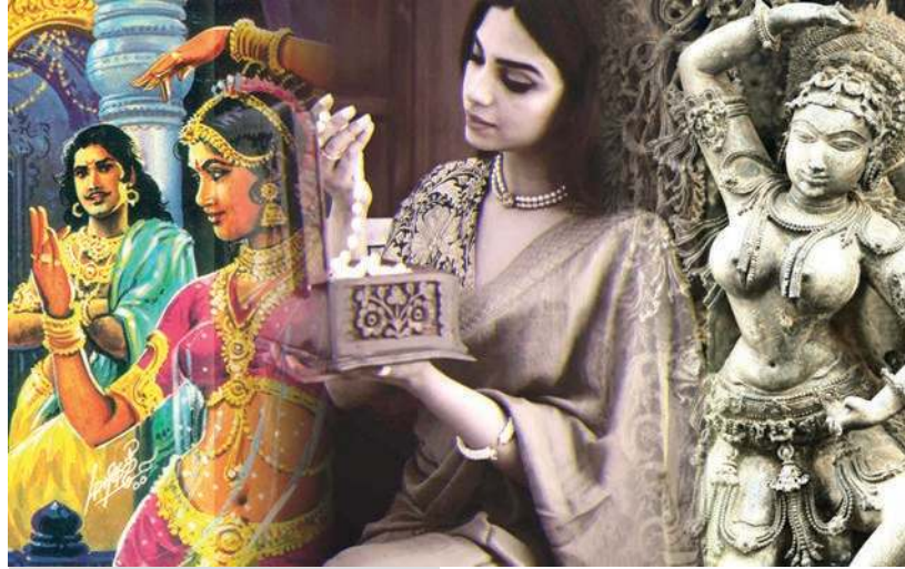
கால் தலையில் ஒலிப்பது சிலப்பதிகாரம் - (Silappatikaram, anklet on foot) கண் கண்ட ஐம்பெரும் கானியத்திலகமே

சிரமதில் திகழ்வது சீவக சிந்தாமணி - (Civaka Cintamani, jewellery on forehead) செவிகளில் மிளிர்வது குண்டலகேசி - (Kundalakesi, stud on ear) திருவே நின் இடையணி மணிமேகலையாம் - (Manimegalai, girdle on waist) கரமதில் மின்னுவது வளையாபதியாம் - (Valayapathi, bangle on hand)