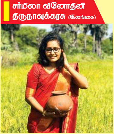
சாமிலா வீனோதீன் திருநாவுக்கரசர் (இலங்கை)

உள்ளாகாத வகையில் எழுத்துக்களின் மேற்பகுதியில் மலையைக் குடைந்து சிறு ஆழத்தில் நீரோட வழி செய்யப்பட்டிருக்கிறது. இங்கு விளையகர், அம்மன், வைரவர் ஆகிய தெய்வங்களுக்கு சிலை வைத்து வழிபடுகின்றார்கள் கிராம மக்கள். உன்னிப்பான அவதானத்திற்குரிய மலையின் இந்த முதற்பகுதியைக் கடந்து மேலும் சில பல அடிகள் பயணப்பட மலைத்தொடரின் அடுத்த பகுதி வரவேற்கிறது. மென் சாய்வு கொண்ட இப்பகுதியால் மலையில் மேல் ஏறிச்செல்ல ஒரு அகழி போன்ற சிறிய நீர்த்தடாகம் வரவேற்கிறது. ஒரு மனிதனை மூடக்கூடிய அளவிற்கு நீர் நிறைந்து காணப்படுகின்ற சிறு நீர்த்தடாகத்தில் நீர் வற்றாமல் எப்பொழுதும் நிறைந்திருக்கும் என்கின்றார்கள் கிராம மக்கள். அந்த நீர்த்தடாகத்திற்கு மேலே மலையின் சற்று உயரமான பகுதியில் நாகத்தை பிரதிபலிக்கும் கந்தையவ வழிபாடு இடம்பெறுகிறது. நீர்த்தேக்கத்தில் இருந்து பார்க்கின்ற போது மலைநோக்கிச் செல்லும் இடப்பகுதியின் உயரமான ஓரிடத்தில் மலையோடு தொடர்பற்ற, எங்கிருந்தோ கொண்டுவரப்பட்டு பொருத்தப்பட்டது