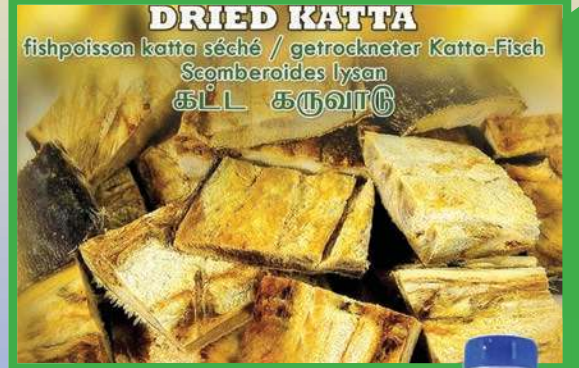
DRIED KATTA fishpoisson katta séché / getrockneter Katta-Fisch Scomberoides lysan கட்ட கருவாடு

இலத்திற்கு வேண்டிய அனைத்து மளிகைப் பொருட்களையும் தரமாகவும் மலிவாகவும் தருகின்றோம்.