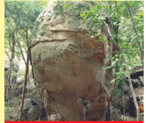
நாக வடிவிலான சீறிய பாறை

உருவாகிய குடியேற்றத்திட்டங்கள் பெருங்கற்காலத்தின் எச்சங்களையும் அதற்கு முந்திய குறுணிக் கற்கால எச்சங்களையும் பறைசாற்றுபவை என்பதுவரலாற்று ஆசிரியர்களின் கருத்தாகும். குளங்களை அச்சொட்டாகக் கொண்ட கிராமங்களும் இன்னும் பூனகரி, மன்னாரின் கட்டுக்கரை மற்றும் தேக்கம் பகுதிகள், வவுனியாவின் செட்டிகுளம், மாமடுவ போன்ற பல பிரதேசங்கள் இவற்றின் எச்சங்களாக எஞ்சி நிற்கின்றன. இங்கு கண்டு கொள்ளப்பட்ட தொல்லியல் எச்சங்கள் இதனை உறுதி செய்கின்றன. இலங்கையில் விஜயன் வருகைக்கு முன்னர் இங்கு ஜக்ச, நாக என்கின்ற இரண்டு இனக்குழுக்கள் வாழ்ந்ததாகவும் அவர்க