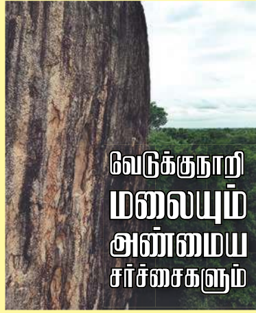
வேடுக்குநாறி மலையும் அன்மைய சர்ச்சைகளும்

அந்தப்பகுதியில் இருந்து மலையில் செங்குத்தாக இன்னும் மேல் நோக்கிச் செல்ல மலையின் உச்சிப்பகுதிக்குச் செல்வதற்குரிய சிறு சமவெளிப் பகுதி தென்படுகின்றது. இச்சமவெளிப்பகுதிக்கு செல்வதற்காக அலுமினிய வேலைப்பாடுகளுடைய பக்களை ஆலய நிர்வாகத்தின் முயற்சியால் அமைத்திருக்கிறார்கள். ஆனால் முழுமையாக அமைப்பதற்கு தொல்லியல் திணைக்களம் அனுமதியை வழங்காத நிலையில் அச்செயற்பாட்டிற்கு எதிராக வழக்கினையும் தொடர்ந்திருக்கிறது