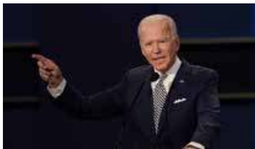
கொண்டு கடந்த ஆறேழு ஆண்டுகளாக நடைபெற்ற கசப்பான ஆட்சியிலிருந்து அமெரிக்காவை விடுவிக்க முடியும் என்றும் ஜோ பைடன் நம்பிக்கைத் தெரிவித்தார்.

ட்ரம்ப்பை நம்பி வாக்களித்த மக்களுக்கு ஏற்பட்டுள்ள ஏமாற்றத்தை தாம் உணர்ந்திருக்கிறார் எனவும் அவர்களையும் இணைத்துக்