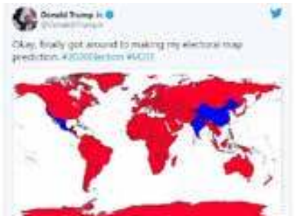
இது சில நிமிடங்களில் நீக்கப்பட்டபோதும், அதற்குள்ளாக ஸ்கிரீன்செட் எடுத்த நெட்டிசன்கள் அதை சமூக வலைதளங்களில் பகிர்ந்து, எரிக் ட்ரம்பை கேலி செய்து வருகின்றனர்.

நவம்பர் 3 ஆம் திகதியே வாக்குப்பதிவு நடந்து முடிந்த நிலையில், நேற்று எரிக் ட்ரம்பின் டூவிட்டர் பக்கத்தில் 'மினசோட்டா மாகாண மக்களே, வெளியே சென்று வாக்களியுங்கள்' என்ற பதிவு வெளியானது.