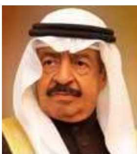
பிரதமர், இன்று புதன்கிழமை காலை காலமானார் என்று பஹ்ரைன் செய்தி நிறுவனம் செய்தி வெளியிட்டுள்ளது.

உலகின் மிக நீண்ட காலம் பணியாற்றிய பஹ்ரைன் பிரதமர் கே கலீஃபா பின் சல்மான் அல் கலீஃபா தனது 84 ஆவது வயதில் உயிரிழந்துள்ளார் என அரசு மானிகை அறிவித்துள்ளது.