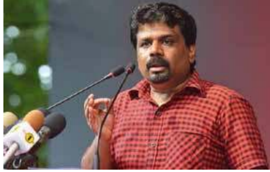
மேலும் தெரிவித்தவை வருமாறு:- அமெரிக்க இராஜாங்க செயலர் ஜனாதிபதியுடனும் வெளிநாட்டலுவல்கள் அமைச்சுடனும் முன்னெடுத்த

பேச்சுகள் தொடர்பாக நாட்டுக்கு வெளிப்படுத்த வேண்டும்.