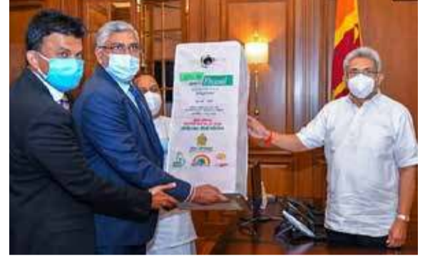
சமர்ப்பிக்கவுள்ளதாக அமைச்சர் மஹிந்த அமரவீர தெரிவித்தார்.

இந்த நிகழ்ச்சித் திட்டத்தை அரசு மற்றும் தனியார் துறை நிறுவனங்கள் நடைமுறைப்படுத்துவதை கட்டாயமாக்குவதற்காக அமைச்சரவை பத்திரம் ஒன்றை