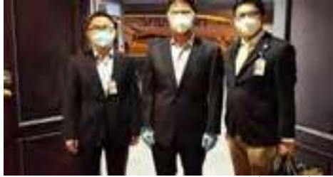
கொழும்பு, ஒக் 31

வெளிநாட்டு இராஜதந்திரிகளின் விஜயங்களின்போது தனிமைப்படுத்தல் சட்டம் அவர்கள் மீது பாய்வதில்லை என்கின்ற விமர்சனங்கள் உள்ள நிலையில் இலங்கைக்கு விஜயம் செய்துள்ள சீனத் தூதுவர் டீச் சென்ஹாங் 14 நாட்கள் தனிமைப்படுத்தப்பட்டுள்ளார்.