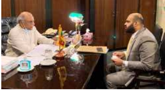
சர்வதேச நாடுகளை அச்சுறுத்தி வரும் கொரோனா வைரஸ் தொற்று காரணமாக மக்களின் இயல்பு வாழ்க்கை பெரிதும் பாதிக்கப்பட்டுள்ளது.

சந்திப்பு தொடர்பில் சாணக்கியன் எம்.பி. தெரிவித்தாவது:-