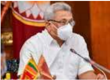
கொழும்பு, நவ. 17

நாட்டில் தற்போது தனிமைப்படுத்தப்பட்டுள்ள பகுதிகளின் நாளாந்த நிலைமை தொடர்பாக ஜனாதிபதி கோட்டாபய ராஜபக்ஷ சம்பந்தப்பட்ட அதிகாரிகளுடன் கலந்துரையாடவுள்ளார்.