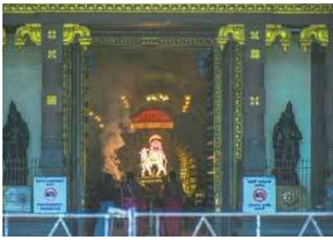
கந்தசஷ்டி உற்சவத்தின் இரண்டாம் நாளான நேற்று நல்லூர் கந்தசுவாமி கோவிலில் மிகவும் பக்தி பூர்வமாக இடம்பெற்றது