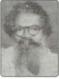
ஏஸ்.ஆர்.ஜேக்கப் - காந்தி -