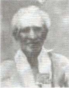
குரன் - தேவரயாளி