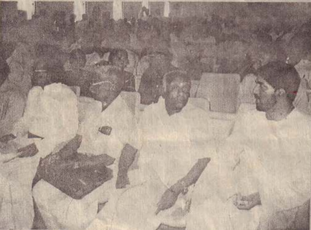
எம்.பி.ந.ரவிராஜ் மற்றும் பிரமுகர்கள்...