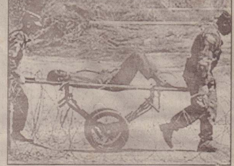
குவாண்டனாமாச் சிறையில் கைத ஒருவர் எடுத்துச் செல்லப்படும் காட்சி.

பென்பதை அமெரிக்காவுக்கு உணர்த்துவோம். இதுவரை அமெரிக்கா சிறு தாக்குதல்களினாலேயே பாதிக்கப்பட்டிருந்தது. இனிமேல் தான் உண்மையான சண்டை தொடங்கவிருக்கிறது. என்று அந்த ஒலி நாடாவில் எச்சரிக்கை செய்யப்பட்டுள்ளது. அல்-சவாரி எகிப்திய கணிசிக்கிச்சை நிபுணர் என்பது குறிப்பிடத்தக்கது. குவாண்டனாமா குடா சிறையில் அறநூறுக்கும் மேற்பட்ட அல்கெய்டா மற்றும் தலிபான் உறுப்பினர்களை அமெரிக்கா அடைத்து வைத்துள்ளமை குறிப்பிடத்தக்கது.