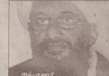
அல்-சவாரி பட்டுள்ளது. குவாண்டனாமா சிறையில் உள்ளவர்களில் ஒருவரான இரக்கவேண்டி வந்தால், அதற்கான விலை என்ன

கியூபாவின் குவாண்டனாமா குடாவில் உள்ள அமெரிக்கச் சிறையில் தடுத்து வைக்கப்பட்டிருக்கும் அல்கெய்டா இயக்க உறுப்பினர்கள் எவருக்கேனும் தீங்கு விளைவிக்கப் படுமாயின் அதற்காக, அமெரிக்கா மிகப் பெரிய விலையைக் கொடுக்க நேரிடும். இவ்வாறு அல்-அராபியா தொலைக்காட்சியில் ஒலிபரப்பான ஒலிநாடாவில் ஓஸாமா பின்லேடனின் வலது கரம் என்று கூறப்படும் அல்-சவாரி எச்சரிக்கை விடுத்துள்ளார். ஆப்கான் போரின்போது பிடிபட்ட தலிபான் மற்றும் அல்கெய்டா உறுப்பினர்களை கியூபாவில் உள்ள அமெரிக்காவின் இராணுவத் தளத்தில் அமெரிக்கா சிறைவைத்துள்ளது. எவ்வித குற்றங்களையும் கமத்தாது. வழக்கும் தொடராத அமெரிக்கா அவர்களை சுமார் இரண்டு ஆண்டுகளாக சிறைவைத்துள்ளது. இந்நிலையிலேயே, அல்கெய்டாவின் இந்த எச்சரிக்கை வெளியிடப்