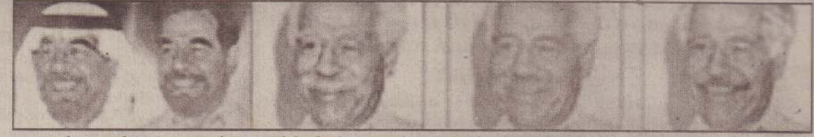
ஈராக் அதிர் பதவியிலிருந்து கவியூக்கப்பட்ட சதாம் ஹுசைன் மாறு வேடத்தில் கிருந்தால், எப்படியிருப்பார் என்பதைக் காட்ட, டிஜிற்றல் தொழில்நுட்பத்தில் மாற்றப்பட்ட வடிவங்கள். அரேபிய பாரம்பரிய உடையில், தாடியுடன், தலைவழக்கை, நரைத்தகுடி, மீசை கிப்படி பல்வேறு தோற்றங்கள் வடிவமைக்கப்பட்டு, அமெரிக்கத் துருப்புகளிடம் வழங்கப்பட்டுள்ளன.