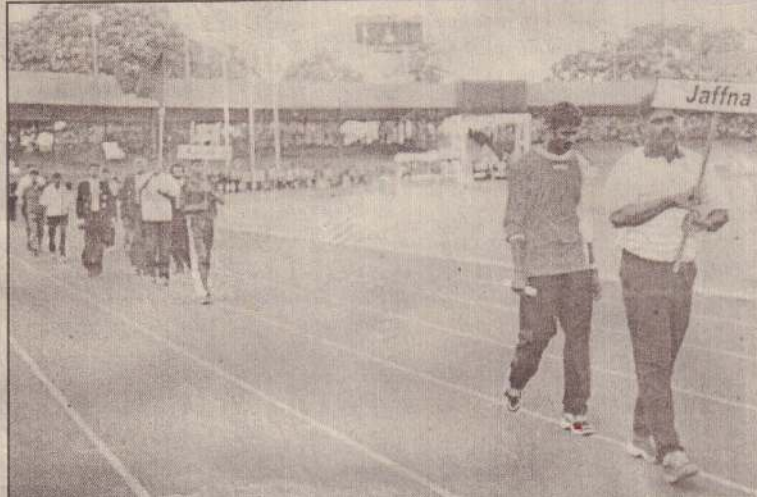
கொழும்பு சுகாதாஸ விளையாட்டரங்கல் கடந்த மாதம் 25ஆம் திகதி முதல் 27ஆம் திகதி வரை இடம்பெற்ற 81ஆவது தேசிய மெய்வன்மைப் போட்டிகளின் ஆரம்ப நிகழ்வின்போது இடம்பெற்ற அணிவகுப்பில் யாழ்ப்பாணம், மாவட்ட அணி குறைந்த எண்ணிக்கையான வீரர்களுடன் கொடியுமின்றி பங்கேற்ற காட்சி.