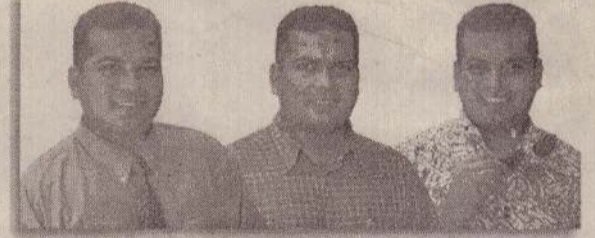
பஜாஜ் - எனது நண்பன்