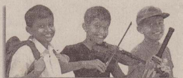
பஜாஜ் - எனது காவலன்

வீட்டில் ஒவ்வொருவருக்கும் ஒவ்வொரு விதமான பயணங்கள் உண்டு. அந்த போக்கு வரத்துக்காக வீணாகும் செலவையும், நேரத்தையும், களைப்பையும் குறைப்பதற்கும், அந்த செலவழியும் பணத்தையும் காலத்தையும் சேமித்து அதை எங்களின் குடும்ப முன்னேற்றத்துக்காக பயன்படுத்த எங்களின் பஜாஜ் வண்டியினால்தான் உதவ முடிந்தது.