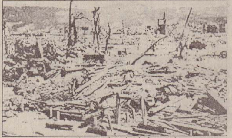
அணுகுண்டு வெடிக்கதில் ஏற்பட்ட நாசம்.

உலகின் முதல் அணுகுண்டுத் தாக்குதலின் 58 ஆவது ஆண்டு தினம் ஜப்பானின் ஹிரோஷிமா நகரில் நேற்று அனுஷ்டிக்கப்பட்டது.