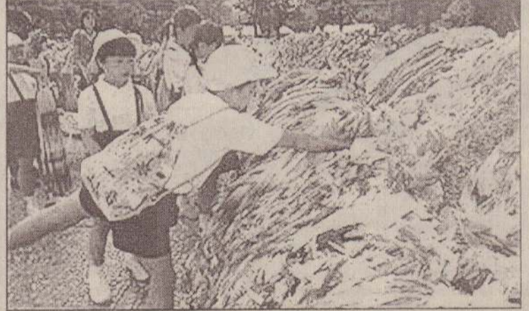
ஜப்பானிய சம்பிரதாயப்படி நீண்ட ஆயுளின் சின்னமாகக் கருதப்படும் காசுக்கை கொக்குகளை நினைவிடத்தில் வைக்கும் சிறுவர்கள்.