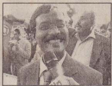
சுடித்தமிழர்களின் பாரம்பரியத் தாயகமான வடக்கு-கிழக்கைப் பிரிப்பதற்கு இலங்கை ஜனாதிபதி