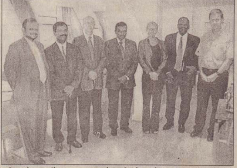
இடைக்கால நிர்வாக வரைவு பற்றி பரிஸில் நடந்த விடுதலைப் புல்களின் சட்ட வல்லுநர்கள் கூட்டத்தின் கிறுதியில் நோவோ சமாதானக் குழுவின் விசேட துறவர் எரிக் சொல்ஹெய்முடன் கலந்துகொண்டார். அவர் அங்கு விடுதலைப் புல்களின் பிரமுகர்களுடன் எடுத்துக்கொண்ட படம்.

தமிழ்ச்செல்வன் குழுவினர் வன்னி திரும்பியதும் புதிய ஆலோசனைகள் அடங்கிய இடைக்கால நிர்வாக வரைவை, அங்கீகரிக்கக்கூடிய தேசியத் தலைவரிடம் சமர்ப்பிப்பர். அவர் அங்கே (12ஆம் பக்கம் பார்க்க)