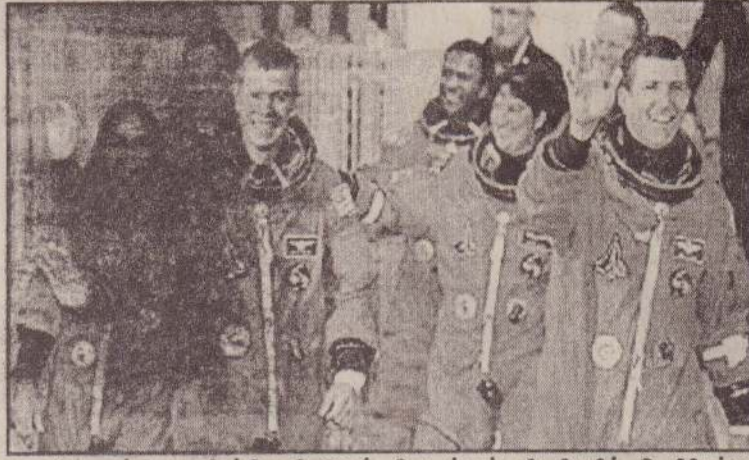
கொலம்பியா விண்வெளி ஓடம் வெடித்துச் சிதறியதில் உயிரிழந்த விண்வெளி வீரர், வீராங்கனைகள் விண்ணுக்குச் செல்ல முன்னர்....

இது குறித்து மூன்று தடைவைகள் பொறியியலாளர்கள் அதிகாரிகளைக் கேட்டிருந்தார்கள் என்றும் - அதனை நிர்வாக அதிகாரிகள் கண்டு கொள்ளாமல் இருந்து விட்டார்கள்.