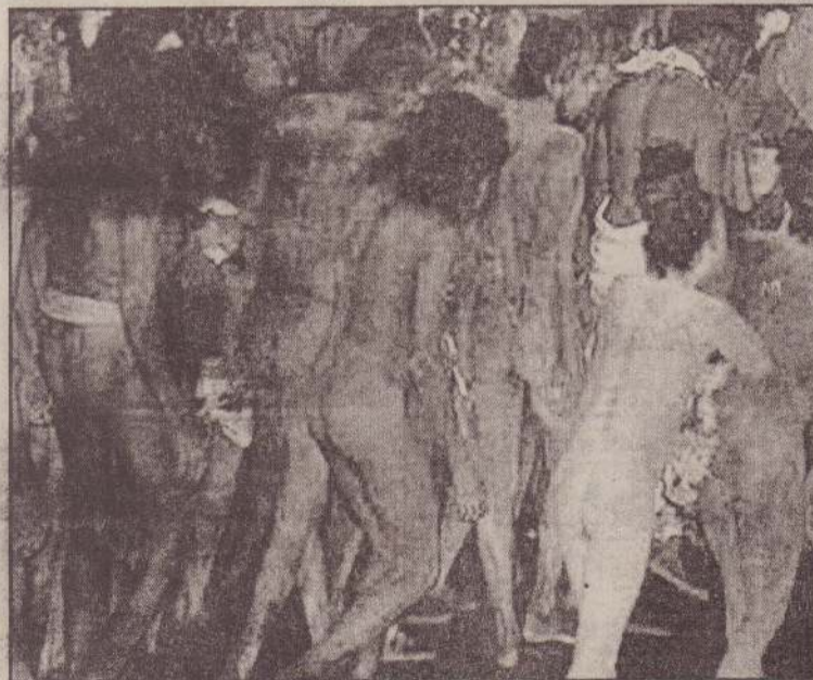
இந்தியாவில் கும்பமேளா விழாவின் போது நிர்வாகமிக உடலெங்கும் விழுத பூசியபடி கோதாவரியில் நீராடச் செல்லும் சாமியார்கள்.

அரசுக்கும் தீவிரவாதிகளுக்குமிடையே கடந்த 1996 ஆம் ஆண்டு முதல் சண்டை நடந்து வருகின்றது. இதில் 7 ஆயிரத்துக்குமேற்பட்ட மரபாவிப் பொதுமக்கள் கொல்லப்பட்டனர்.