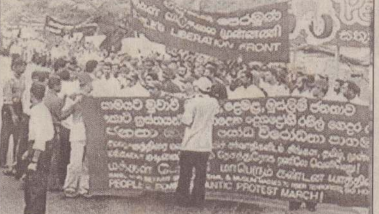
அளுத்தகமையிலிருந்து ஜே.வி.பியின் பேரணி நேற்று ஆரம்பமானபோது...

னர்கள் சென்று வழிபடுவதற்கு வசதியாக விசாரையை மீண்டும் கட்டி பெழுப்பத் தற்போது திட்டமிடப்பட்டுள்ளது. மடுமாதா ஆலயம் உட்பட இப்பிரதேசத்தில் உள்ள வணக்க ஸ்தலங்களைப் புனரமைக்குமாறு பிரதமர் ரணில் விக்கிரமசிங்க பணிப்புரை வழங்கியுள்ளார். மடுமாதா ஆலயத்திலிருந்து ஐந்து மைல்களுக்கு முன்னால் அமைக்கப்படும் இந்த விசாரையில் புத்தர் சிலை நிறுவ்வதற்கான செலவை அப்பிரதேசத்தில் பணிபுரியும் பொலீஸாரே (12ஆம் பக்கம் பார்க்க)