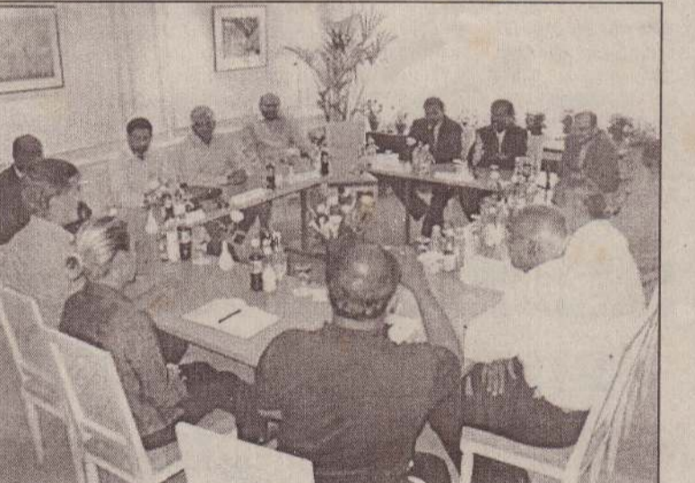
கிவங்கை அரசு முன்வைத்துள்ள கிடைக்காலை நிர்வாக வரைவு குறித்து விடுதலைப் புலிகளின் பிரதிநிதிகள் சட்ட வல்லுநர்களுடன் பரீலில் முன்று நாள் கலந்துரையாடல்களை நடத்தியுள்ளனர். அதன் கிறதியில் நோர்வே சமாதானக் குழுவின் விசேட பிரதிநிதி எர்லிசாஸ் ஹெய்ம் கலந்துகொண்டு விடுதலைப் புலிகளின் பிரதிநிதிகளுடன் பேச்சுக்களை நடத்தினார்.