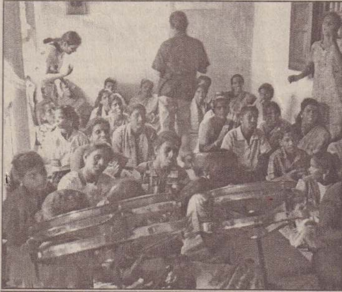
இடம்பெயர்ந்த பெண்கள் பங்குபற்றிய அரங்கு நிகழ்வில் எடுக்கப்பட்ட படம்.