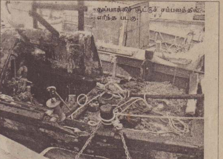
துப்பாக்கிச் சூட்டுச் சம்பவத்தில் எரிந்த படகு.

யாழ்ப்பாணம், செப்.1 குருநகர்ப் பகுதி மீனவர்கள் நேற்றுக் கடற்றொழிலுக்குச் செல்லாமல் பகிஷ்கரிப்பில் ஈடுபட்டனர். குருநகர் சென்ட்ரேல்ஸ் வீதியில் அமைந்துள்ள குருநகர் கடற்றொழிலாளர் அபிவிருத்திச் சங்கம் முன்பாக நேற்றுக்காலை 10 மணி முதல் ஒன்று கூடிய மீனவர்கள் அறிவுறுத்தும் ஆத்திரமும் அடைந்த நிலையில் காணப்பட்டனர். குருநகர் மீனவர்களுக்குச் சொந்தமான ட்றோலர் படகுகளை நோக்கி நேற்றுமுன்தினம் கடலில் நடத்தப்பட்டதாகக் கூறப்படும் துப்பாக்கிப் பிரயோகச் சம்பவத்துக்குக் கண்டனமும் எதிர்ப்பும் தெரிவித்தே மீனவர்கள் நேற்றுப் பகிஷ்கரிப்பில் ஈடுபட்டனர். காலையில் ஒன்றுகூடி தங்கள் எதிர்ப்பைத் தெரிவித்த மீனவர்கள் பின்னர் யாழ். பிரதான வீதியில் அமைந்துள்ள கடற்றொழிலாளர்கள் கூட்டுறவுச்சங்கங்களின் சமாச்சி பணிமனையையும் தாக்கிச் சேதப்படுத்தினர். அந்தப் பணிமனை வளவில் அமைந்திருந்த வடமர்காண கடற்றொழிலாளர் கூட்டுறவுச் சங்கங்களின் சம்மேளனப் பெயர்ப்பலகையையும் அடித்து நொறுக்கினர். இதன் காரணமாக அந்த அலுவலகம் உடனடியாக இழுத்து மூடப்பட்டது. யாழ். சின்னக்கடைப் பொதுச்சந்தை மற்றும் இறைச்சிக்கடைகள் என்பனவும் மூடப்பட்டன. (18ஆம் பக்கம் பார்க்க)