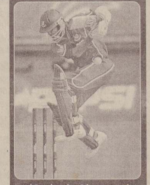
பந்தொன்றைத் தடுத்தால் முயலும் பங்களாதேஷ் துடுப்பாட்ட வீரர் நபீஸ் இக்பால்

சென்னை, செப். 14 இந்திய கிரிக்கெட் கட்டுப்பாட்டுச் சபையின் வழிகாட்டுதல் குழுத்தலைவராக ஜக்மோகன் டால்மியா தெரிவுசெய்யப்பட்டுள்ளார். தற்பொழுது இந்திய கிரிக்கெட் கட்டுப்பாட்டுச் சபையின் தலைவராக இருக்கும் டால்மியாவின் பதவிக்காலம் எதிர்பாரும் 29ஆம் திகதியுடன் நிறைவடையவுள்ளது. இதனைக் கருத்திற்கொண்டே வழிக்காட்டுதல் குழுத்தலைவர் பதவியை டால்மியாவுக்கு வழங்க கிரிக்கெட் கட்டுப்பாட்டுச்சபை உறுப்பினர்கள் முன்வந்தனர். (10)