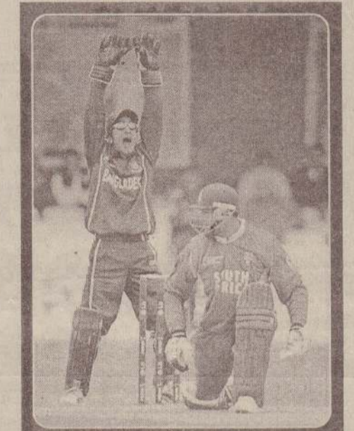
தென்னாபிரிக்க வீரர் ஜக்கலிஸின் ஆட்டமிழப்பு தொடர்பாக முறையே செய்யும் பங்களாதேஷ் விக்கெட் காப்பாளர்

இருவரும் சிறந்த வீரர்கள் என்பதில் எவ்வித சந்தேகமும் இல்லை. கடந்தகாலங்களில் இவர்கள் இந்திய அணியின் வெற்றிகள் பலவற்றுக்குக் காரணமாக இருந்துள்ளனர். ஆனால் சிலகாலமாக இருவரது துடுப்பாட்டத் திறனும் வீழ்ச்சி கண்டுள்ளது எனவும் அடுத்த போட்டியில் இவர்கள் தமது திறனை வெளிப்படுத்தாவிட்டால் இவர்களை அணியில் சேர்த்துக்கொள்வது பற்றி ஆலோசிக்க வேண்டியவரும் எனவும் கங்குலி எச்சரிக்கை விடுத்துள்ளார். (10)