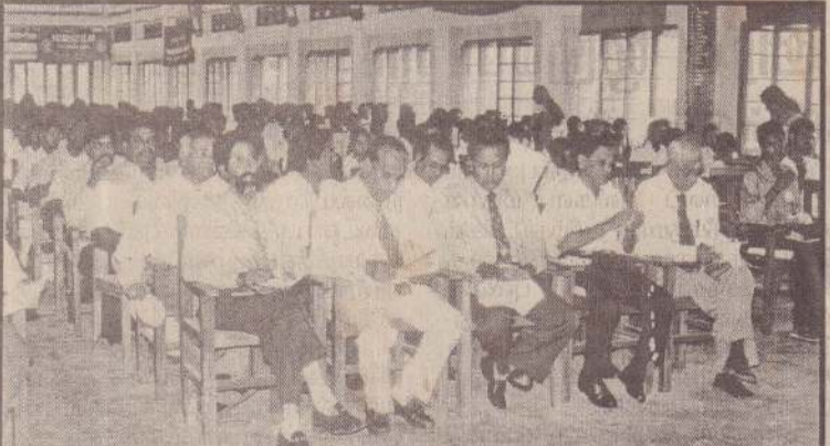
வைரவிழாவில் கலந்துகொண்டோர் ஒரு பகுதியினர்.