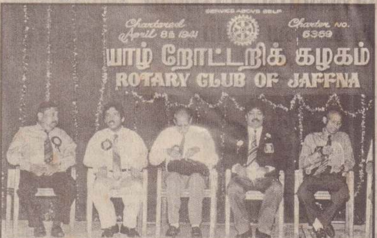
நேற்றைய விழா மேடையின் தோற்றம்.