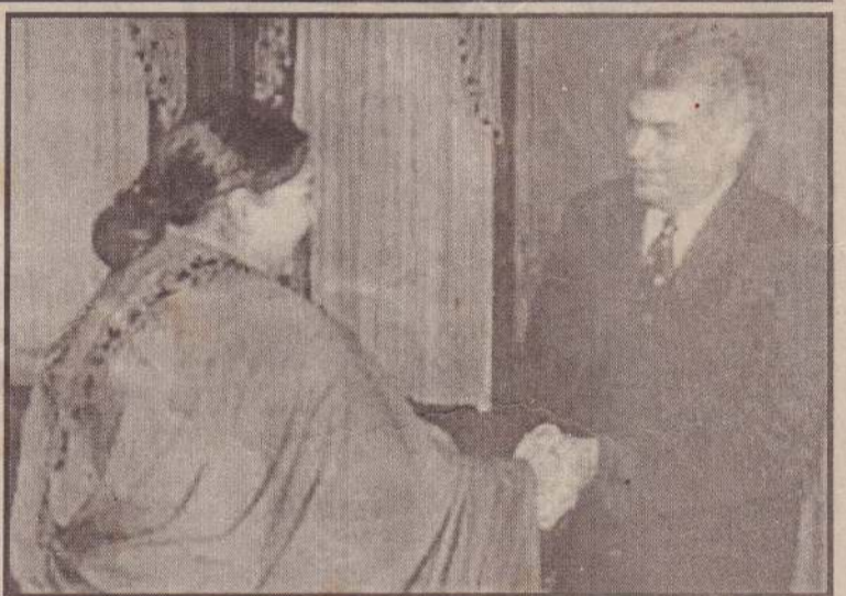
ஆறுநாள் விஜயத்தை மேற்கொண்டு கிந்தியா சென்றிருக்கும் ஸ்ரீலங்கா எதிர்க்கட்சித் தலைவர் ரணில் விக்கிரமசிங்க நேற்று முன்தினம் சென்னையில் தமிழக அரசின் தலைமைச் செயலகத்தில் தமிழக முதல்வர் செல்வி ஜெயலலிதாவைச் சந்தித்தபோது எடுக்கப்பட்ட படம்.

பலியான படையினரின் சடலங்கள் பொலன்னறுவை வைத்தியசாலைக்கு (14 ஆம் பக்கம் பார்க்க)