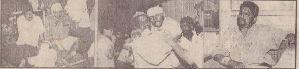
கர்நாடகாவில் தாக்குதலுக்குள்ளாகி சென்னை வந்து சேர்ந்த படப்பிடிப்புக் குழுவினரையும், இயக்குநர் கே.எஸ்.ரவிக்குமார் கையில் காயத்துடன் நடந்ததை விவரிப்பதையும் படங்களில் காணலாம்.