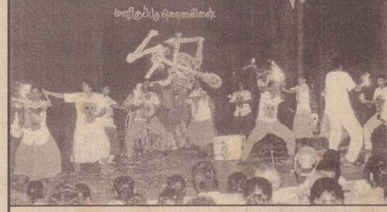
காணாமற்போனோர் குடும்பங்களைச் சேர்ந்த சிறுவர்களின் கல்வி வளர்ச்சிக்கு நதி சேகரிக்கும் வகையில் அண்மையில் யாழ்ப்பல்கலைக்கழக முகாமைத்துவக் கற்கைகள் வணிக்பீட மாணவர் ஒன்றியத்தினால் நடத்தப்பட்ட 'உயிர்விசை' நாடகத்தில் ஒரு காட்சி.