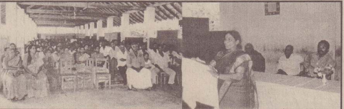
ஆரம்பக் கல்வி மாணவரின் பெற்றோர்களுக்கான புதிய கல்விச் சீர்திருத்தம் பற்றிய கருத்தரங்கு சமீபத்தில் உரும்பிராய் சைவத் தமிழ் வித்தியாலயத்தில் கிடம்பெற்றது.

இவ்வாறு அரசுக்குள்ளே சமாதானம் தொடர்பாக இருவேறு நிலைப்பாடுகள் நிலவுகின்றன என்ற கருத்து உலக நாடுகளில் பரவும் போது அது சமாதான முயற்சிகளில் பெரிதும் பாதிக்கும் என்ற உண்மையை நாம் ஏற்றுக்கொள்ளவேண்டும்.