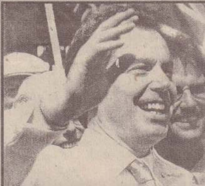
வெற்றிக் களிப்பில் ரொனி பிளையர்

தேர்தல் முடிவுகளின் படி கென்சர் வேட்டில் கட்சி 146 இடங்களையும் லிபரல் கட்சி 41 இடங்களையும் பெற்றுள்ளன. மிகுதி 70 இடங்களுக்குமான முடிவுகள் நேற்றிரவே வெளியாகிவிடும் என்று எதிர்பார்க்கப்பட்டது. தொழிற்கட்சியின் பெரும் வெற்றியை அடுத்து ரொனி பிளையர் இரண்டாவது தடவையாகவும் பிரிட்டிஷ் பிரதமராக பதவி ஏற்கவுள்ளார். தனது கட்சி நாடாளுமன்றில் அறிதிப் பெரும்பான்மையைப் பெறும் நிலையை எட்டியுள்ளதை அடுத்து நேற்று செய்தியாளர்களிடம் பேசிய ரொனி பிளையர் -