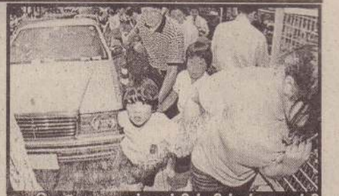
கொடூரமான சம்பவத்தின் பின்னர், ஆபத்திவிருந்து தப்பிய தமது சூழ்நிலைகளை, இழுத்தபடி வீடுகளுக்கு விரையும் பெற்றோர்.

ஜப்பானில் மனவிரக்தியினால் நோக்கமின்றி, அடுத்தவரைத் தாக்கும் சம்பவங்கள் சமீகாலமாக அதிகரித்து வருவதாகக் கூறப்படுகிறது. (ஓ-4-7)