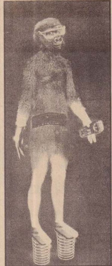
குரங்கு மனிதனின் கற்பனை வடிவம்

அவன் வருவது நிச்சயம் உங்களுக்குத் தெரியும். அவனது வரு