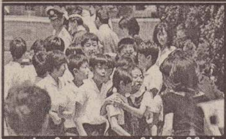
ஜப்பானியப் பாடசாலைமீல் வெறிபிடித்த நபரிடமிருந்து தப்பிய சிறுவர்கள், ஒருவரை ஒருவர் தேற்றும் காட்சி.