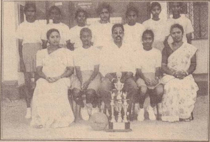
19 வயதிற்குட்பட்ட வலைப்பந்தாட்டக் குழுவின்ரையும் இரண்டாம் இடம்பெற்ற 17 வயதுக்குட்பட்ட வலைப்பந்தாட்டக் குழுவின்ரையும் பாராட்டுவதுடன் மாகாண மட்டத்திலும் வெற்றிபெற வாழ்த்துவதுடன் அதற்காக, அயராது உழைத்த அதிபரையும் ஆசிரியர்களையும் பயிற்றுநர்களுக்கும் பாராட்டி வாழ்த்துகின்றோம்.

பழைய மாணவர் சங்கம், யூனியன் கல்லூரி, தெல்லிப்பழை.