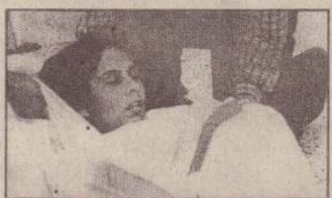
இஸ்ரேலியின் 'ஷெல்' தாக்குதலில் உயிரிழந்த 17 வயது பலஸ்தீன புவதியின் சடலம்.

இஸ்ரேலியப் பிரதமர் ஏரியல் ஷெரோன் மோதலை முடிவுக்குக் கொண்டுவர ஆர்வம் காட்டியதாலும் -