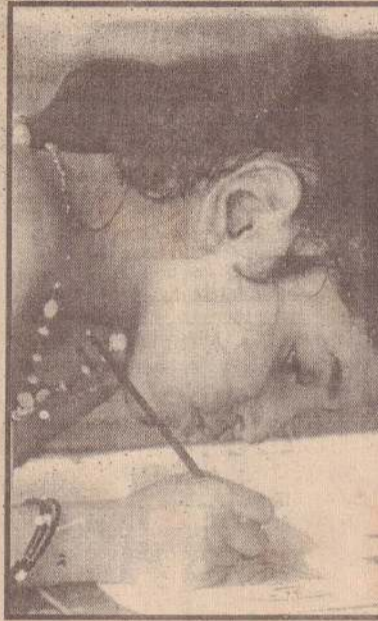
செய்து, சித்திரவதை செய்வது சிறுவர் வாழ்வில் மறக்க முடியாத அனுபவமாகும்.

இலங்கையின் வடக்கு - கிழக்கு யுத்த பிரதேசத் திணுள் சிறார்களில் பெரும்பாலானோர் பாதிக்கப்பட்டுள்ளனர். நீண்ட காலமாக யுத்தம் நடைபெறும் போது குடும்ப உறவும் திருமண வாழ்க்கை, சமய வழிபாடுகள், பாடசாலைக்கல்வி போன்றவற்றின் அமைப்புகள் கட்டாயமாக வீழ்ச்சியடையவோ அல்லது செயலிழக்கவோ கூடும்.