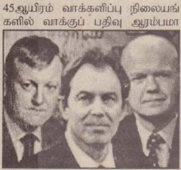
பிரிட்டிஷ் தேர்தலில் போட்டியிடும் முக்கிய வேட்பாளர்களான சான்ஸ் கெனடி, ரொனி பிளையர், வில்லியம் ஹேக் ஆகியோரைப் படத்தில் காணலாம்.

லண்டன், ஜூன் 8 - பிரிட்டிஷ் நாடாளுமன்றத் தேர்தல்களான வாக்களிப்பு நேற்று இடம் பெற்று முடிந்தது. இந்தத் தேர்தலில் முக்கிய போட்டியாளர்களான தொழிற் கட்சித் தலைவர் ரொனி பிளையரா, கென்சர் வேட்டிவ் கட்சித் தலைவர் வில்லியம் ஹெக்கா வெற்றி பெறுவர் என்ற விவரம் உணைகமாக இன்று மாலைக்குள் தெரியவரும் என்று எதிர்பார்க்கப்படுகின்றது. 659 நாடாளுமன்ற உறுப்பினர்களைத் தெரிவுசெய்வதற்காக நடத்தப்பட்ட இந்தத் தேர்தலில் 14 கட்சிகளைச் சேர்ந்த 3 ஆயிரத்து 294 வேட்பாளர்கள் போட்டியிட்டனர். நேற்றுக் காலை 7.00 மணிக்கு