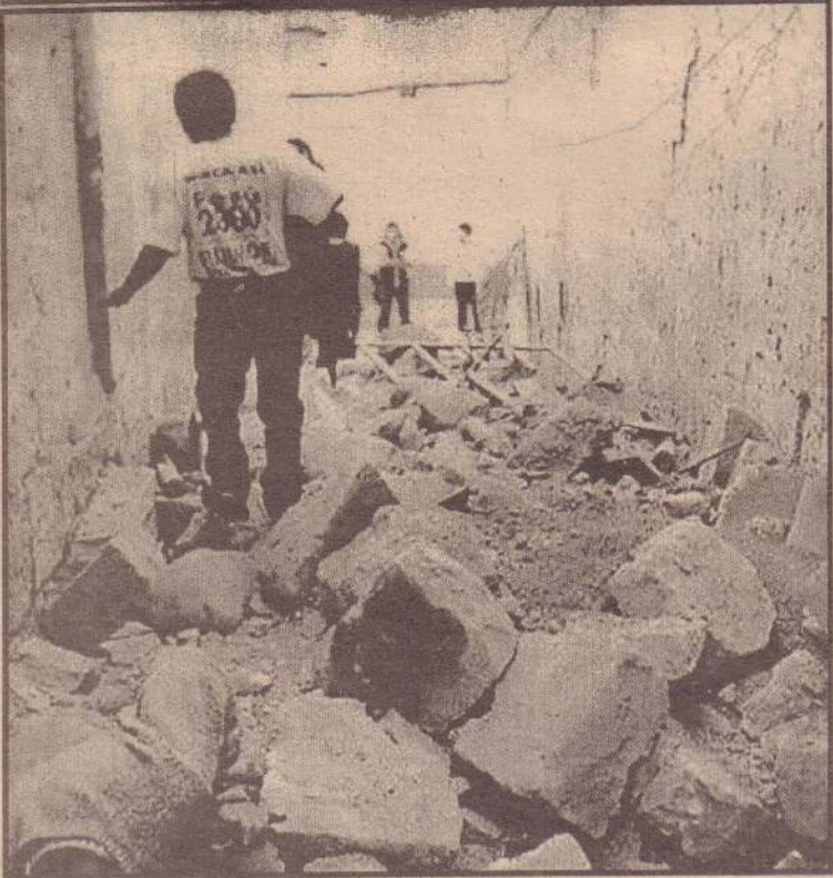
தென் அமெரிக்க நாடான பெருவில் கடந்த சனிக்கிழமை ஏற்பட்ட பூமியதிர்ச்சியால், கட்டடங்கள் தகர்ந்து விழுந்துள்ள காட்சி. இந்தப் பூமியதிர்ச்சியில் கிறித்தவர்களின் எண்ணிக்கை 97 ஆக உயர்ந்துள்ளது. மேலும் 58 பேரைக் காணவில்லை என்று தெரிவிக்கப்பட்டது.