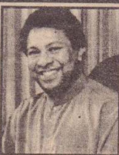
எள்ள விடுதலைப் புலிச் சந்தேக நபர்களை விடுதலை செய்ய வேண்டிய நிலையும் ஏற்படும் எனவே இவ் (14ஆம் பக்கம் பார்க்க)