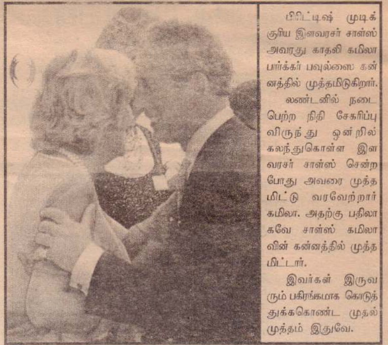
பிவிட்டிஷ் முடிக்குரிய இளவரசர் சான்ஸ் அவரது காதலி கமிலா பாக்கர் பவுல்லை கன்னத்தில் முத்தமிடுகிறார். லண்டனில் நடைபெற்ற நிதி சேகரிப்பு விருந்து ஒன்றில் கலந்துகொள்ள இளவரசர் சான்ஸ் சென்ற போது அவரை முத்தமிட்டு வரவேற்றார் கமிலா. அதற்கு பதிலாகவே சான்ஸ் கமிலாவின் கன்னத்தில் முத்தமிட்டார்.

இவர்கள் இருவரும் பகிரங்கமாக கொடுத்துக்கொண்ட முதல் முத்தம் இதுவே.