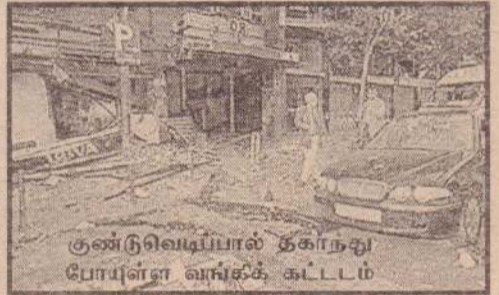
குண்டு வெடிப்பால் தகர்ந்து போய்ள்ள வங்கிக் கட்டடம்

ஸ்பெயின்ன் டெபுத்யூலும் பிரான்ஸின் தென்மேற்குப் பகுதியிலும் தமக்கு சுதந்திரப் பிராந்தியம் கேட்டு சு.ரி.ஏ. போராடி வருகின்றது. கடந்த 33 வருடகாலமாகத் தொடர்ந்து வரும் இந்தப் போராட்டத்தில்