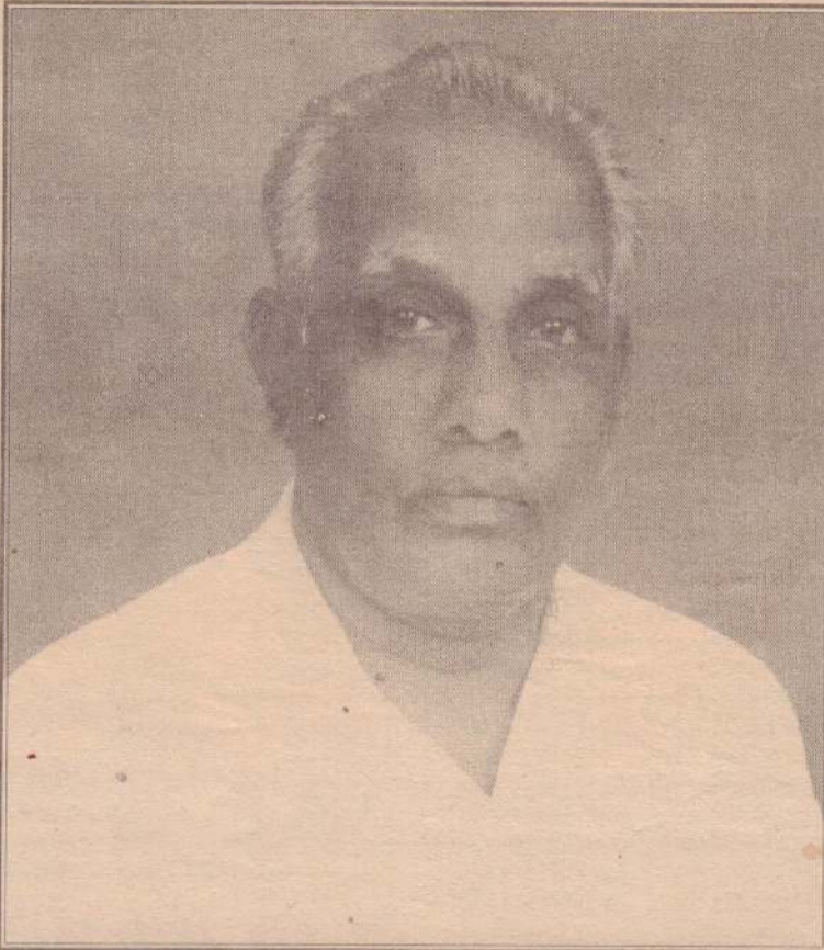
விழா நாயகரின் சமூக சேவைக் குறிப்புகள்