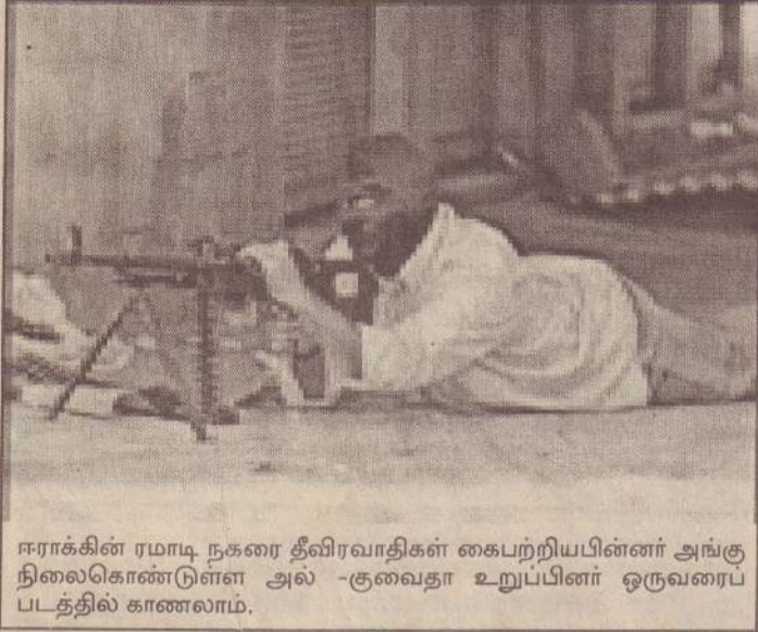
ஈராக்கின் ரமாடி நகரை தீவிரவாதிகள் கைபற்றியபின்னர் அங்கு நிலைகொண்டுள்ள அல்-குவைதா உறுப்பினர் ஒருவரைப் படத்தில் காணலாம்.