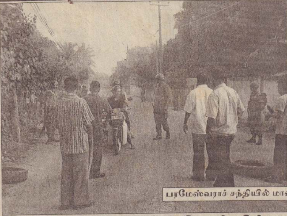
பரமேஸ்வராச் சந்தியில் மாணவர் படையினர் முறுகல்