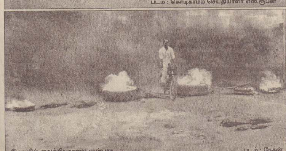
இணுவில் வைத்தியசாலை முன்பாக. படம் : நேசன்