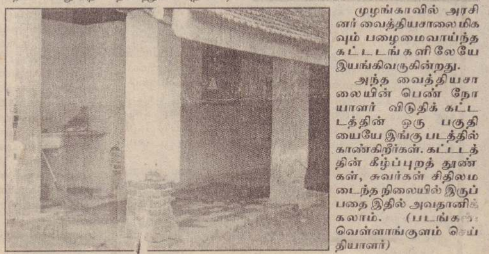
முழங்காவில் அரசினர் வைத்தியசாலையிலும் பழைமைவாய்ந்த கட்டடங்களிலேயே இயங்கிவருகின்றது. அந்த வைத்தியசாலையின் பெண் நோயாளர் விடுதிக் கட்டடத்தின் ஒரு பகுதியையே இங்கு படத்தில் காண்கிறீர்கள். கட்டடத்தின் கீழ்ப்புறத் தூண்கள், சுவர்கள் சிதிலமடைந்த நிலையில் இருப்பதை இதில் அவதானிக்கலாம்.

இலங்கை கல்வி நிர்வாக சேவை, இலங்கை அதிபர் சேவை ஆகியவற்றுக்கு ஆள்களைச் சேர்த்துக்கொள்வதற்கான போட்டிப் பரிட்சைக்கும் அதிபர் சேவையில் வினைத்திறன் காண தடைப்பரிட்சைக்கும் தோற்றுபவர்களுக்கான வழிகாட்டல் வகுப்புகளை இலங்கைத் தமிழர் ஆசிரியர் சங்கம் நடத்திவருகின்றது. இவ்வகுப்புகள் கிளிநொச்சியிலும் முல்லைத்தீவிலும் இன்றும் நாளையும் நடத்தப்படவுள்ளன. கிளிநொச்சியில் கிளிநொச்சி மகா வித்தியாலயத்திலும் முல்லைத்தீவில் புதுக்குடியிருப்பு மத்திய கல்லூரி, யோகபுரம் மகா வித்தியாலயம் ஆகிய இடங்களிலும் இவ்வகுப்புகள் நடைபெற ஏற்பாடாகியுள்ளன. துறைசார் வல்லுநர்களால் நடத்தப்படுகின்ற இவ்வகுப்புகள் காலம் 8.30 மணிதொடக்கம் மாலை 5 மணிவரை நடைபெறும் எனவும் - இவ்வகுப்புகளில் குறைந்த கட்டணத்தில் பொருத்தமான கையேடுகளும் வழங்கப்படவுள்ளன என்றும் - குறித்த பரிட்சைக்குத் தோற்றுள்ளவர்கள் பங்குகொண்டு பயனடையுமாறும் இலங்கைத் தமிழர் ஆசிரியர் சங்கம் அறிவித்துள்ளது. (த-405)