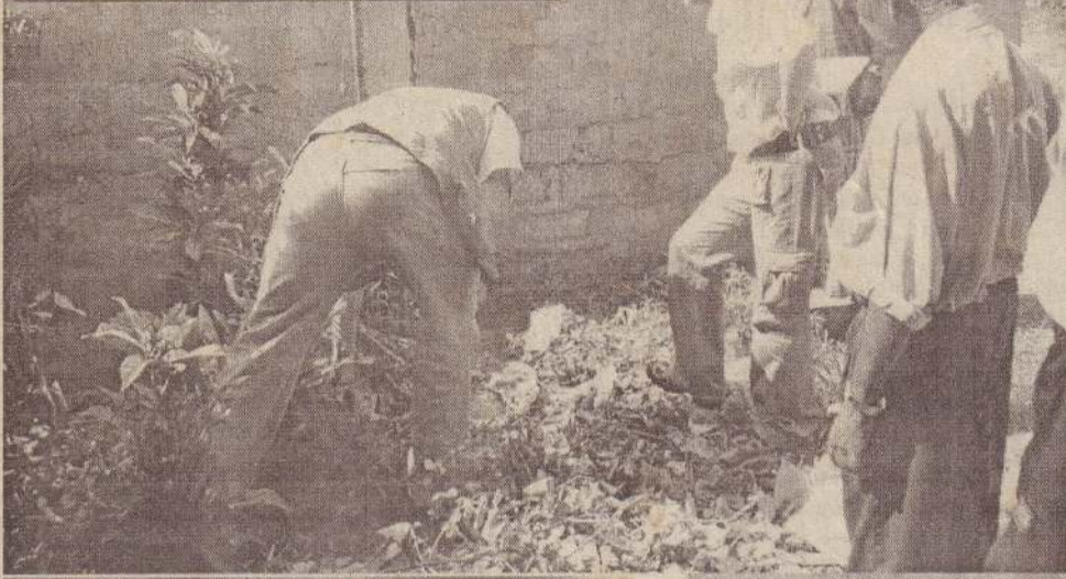
நீர்வேலியில் சூட்டுச் சம்பவம் நடைபெற்ற இடத்தைப் பார்வையிட்டு நடவடிக்கைகளைச் சேகரிக்கும் கண்காணிப்புக் குழுவினர்.