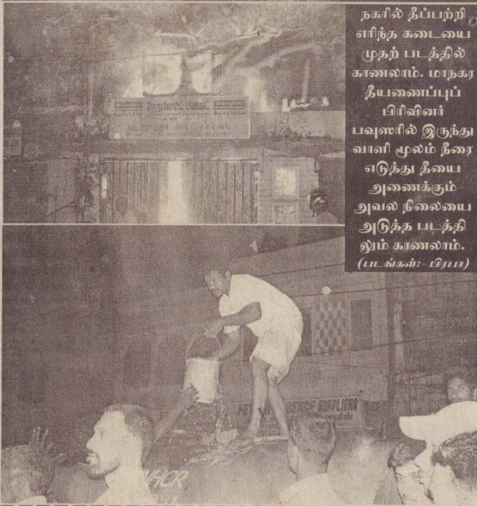
நகரில் தீப்பற்றி எரிந்த கலையை முதல் படத்தில் காணலாம். மாநகர தீயணைப்புப் பிரிவின் பவுஸரில் இருந்து வாரி மூலம் நீரை எடுத்து தீயை அணைக்கும் அவல நிலையை அடுத்த படத்திலும் காணலாம்.