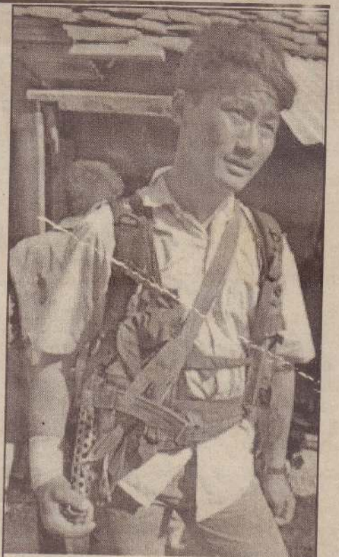
நேபாளத்தில் மாவோயிஸ்ட் தீவிரவாதிகள் போர்நிறுத்தத்தை மேலும் ஒரு மாதத்துக்கு நீடித்துள்ளனர். இதனை நேபாள எதிர்க்கட்சிகள் வரவேற்றுள்ளன. நேபாள மலைப் பகுதியில் மாவோயிஸ்ட் தீவிரவாதி ஒருவர் பாதுகாப்பு நடவடிக்கையில் ஈடுபட்டிருப்பதைப் படத்தில் காணலாம்.