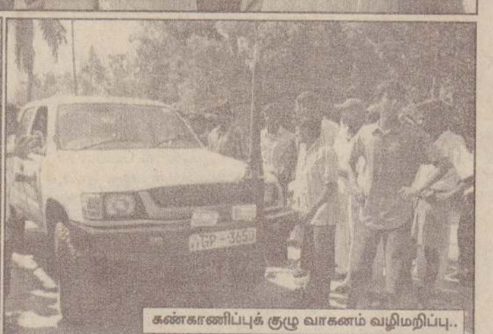
கண்காணிப்புக் குழு வாகனம் வழிமறிப்பு..