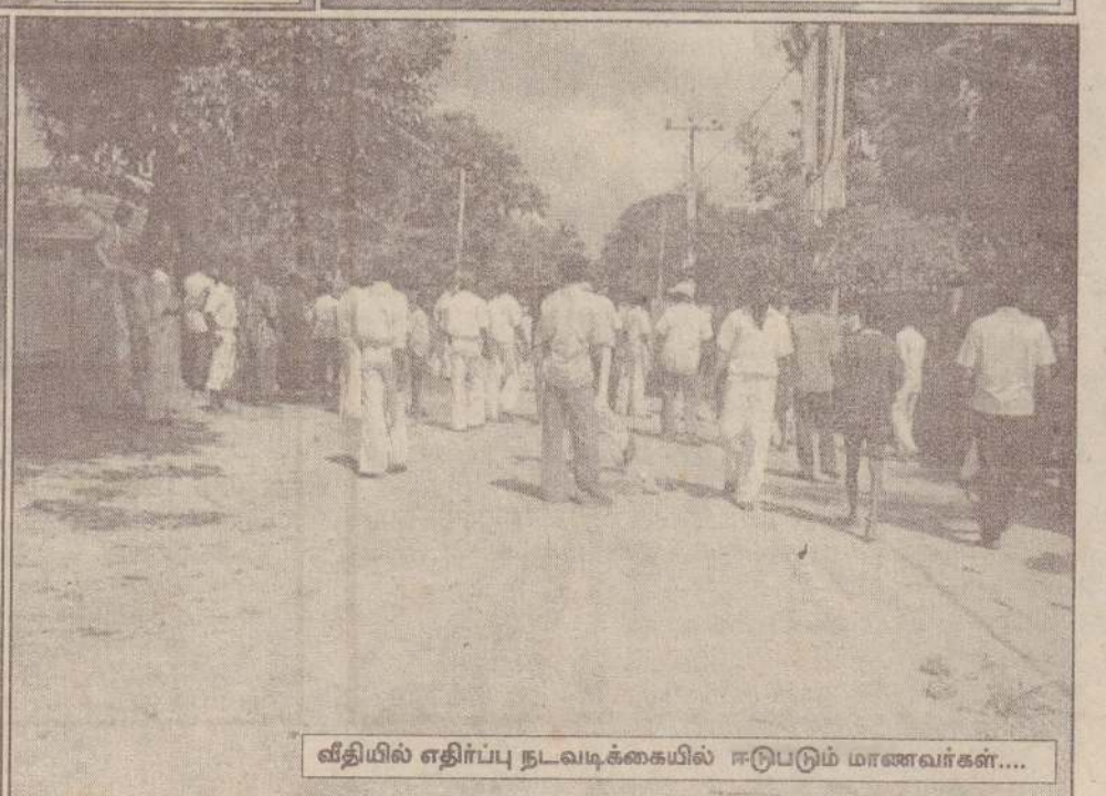
வீதியில் எதிர்ப்பு நடவடிக்கையில் ஈடுபடும் மாணவர்கள்....