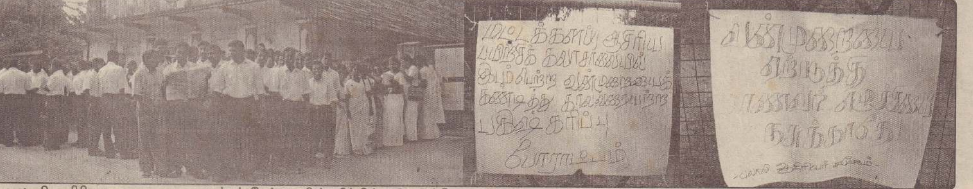
பலாலி ஆசிரிய கலாசாலை மாணவர்கள் நேற்று பகிஷ்கரிப்பில் ஈடுபடும்போது எடுக்கப்பட்ட படங்கள் இவை. ஆசிரிய மாணவர்கள் பகிஷ்கரிப்பில் ஈடுபடுவதனையும் கலாசாலை வாயில் இழுத்து மூடப்பட்டு அதில் சலோக அட்டைகள் தொங்கவிடப்பட்டிருப்பதையும் படங்களில் காணலாம்.