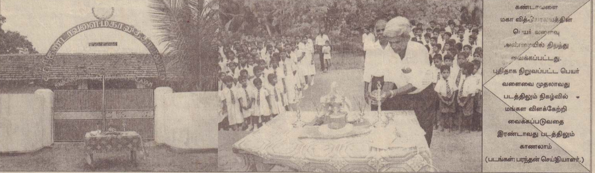
கண்டாவளை மகா விதிபரவயத்தின் பெயர் வளைவு அடங்கியில் திறந்து வைக்கப்பட்டது. புதிதாக நிறுவப்பட்ட பெயர் வளைவை முதலாவது படத்திலும் நிகழ்வில் மங்கள விளக்கேற்றி வைக்கப்படுவதை இரண்டாவது படத்திலும் காணலாம்

'தமிழன்' என்றோர் இனமுண்டு தனியே அவர் கொருகுணமுண்டு' நமது கலாசார, பண்பாடுகள் எச்சுழ்நிலையிலும் கை விடப்படக் கூடாது. முன்னைப் பழமைக்கும், பின்னைப் புதுமைக்கும் உரியவர்களாகத் திகழ வேண்டும். மாற்றம்