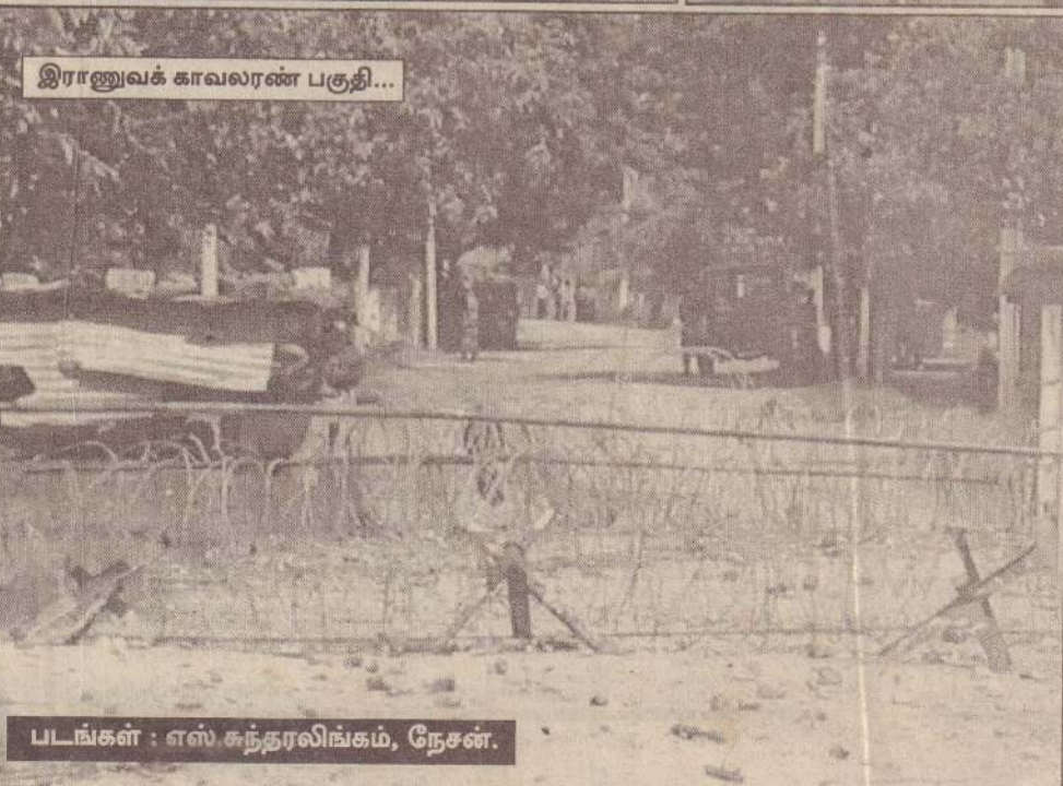
இராணுவக் காவலரண் பகுதி...