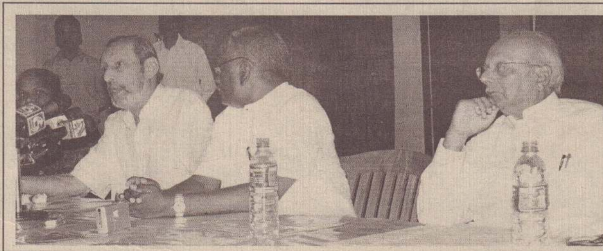
சோஷலிச மக்கள் முன்னணியின் கிழக்குமாகாண மாகாணசபைத் தேர்தல் சம்பந்தமான செய்தியாளர் மாநாடு நேற்றுமுன்தினம் சனிக்கிழமை நடைபெற்றது. இந்த மாநாட்டில் தேசிய மொழிகள் மற்றும் சமூக ஒருமைப்பாட்டு அமைச்சர் வாசுதேவ நாணாயக்கார உரையாற்றுவதையும் அருகில் சிரேஷ்ட அமைச்சர் திஸ்ஸ விதாரண உட்பட பலர் அமர்ந்திருப்பதையும் காணலாம். (31)

படையினர் மற்றும் இராணுவத்தினர் விசாரணைகளுக்காகச் சென்றுள்ளனர். இதுதொடர்பான மேலதிக விசாரணைகளை வவுணதீவு பொலிஸார் மேற்கொண்டு வருகின்றனர். தம்புள்ள பள்ளிவாசலில் ஆரம்பித்த தாக்குதல் இன்று பல இடங்களிலும் உள்ள பள்ளிவாசல்கள் தாக்கப்பட்டும், தீக்கிரையாக்கப்பட்டும் வருகின்றமை குறிப்பிடத் தக்கது. (ச)