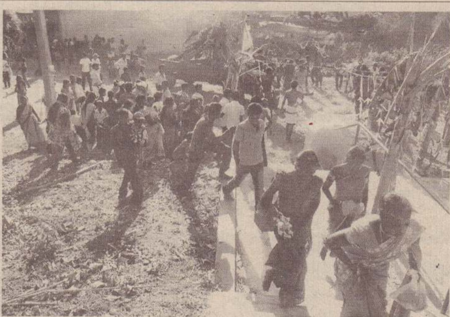
வவுனியா சிதம்பரபுரம் திருப்பழனி முருகன் ஆலயத்தின் வருடாந்த அலங்கார உற்சவத்தினதன்று மலைப்படியூடாகப் பக்தர்கள் ஆலயத்திற்குச் செல்கின்றனர். (க-402)

இங்கு தொடர்ந்தும் மழை பெய்யாது வரட்சி நிலை நீடிக்காமல் மிகப்பெரிய அளவில் நிலவுவதற்கான சாத்தியங்கள் உள்ளதாகவும் தெரிவிக்கப்பட்டுள்ளது. (க-12)