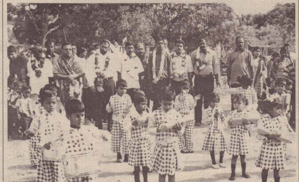
வறிய குடும்பங்களிலுள்ள மாணவர்களின் கல்வி வளர்ச்சிக்கு உதவும் முகமாகக் கல்விசார் உதவி நிறுவனமொன்று வவுனியா மகாரம்பைக் குளத்தில் அங்குராப்பணம் செய்து வைக்கப்பட்ட போது அதில் கலந்து கொண்ட விருந்தினர்கள் அழைத்து வரப்படுகின்றனர். (க-402)