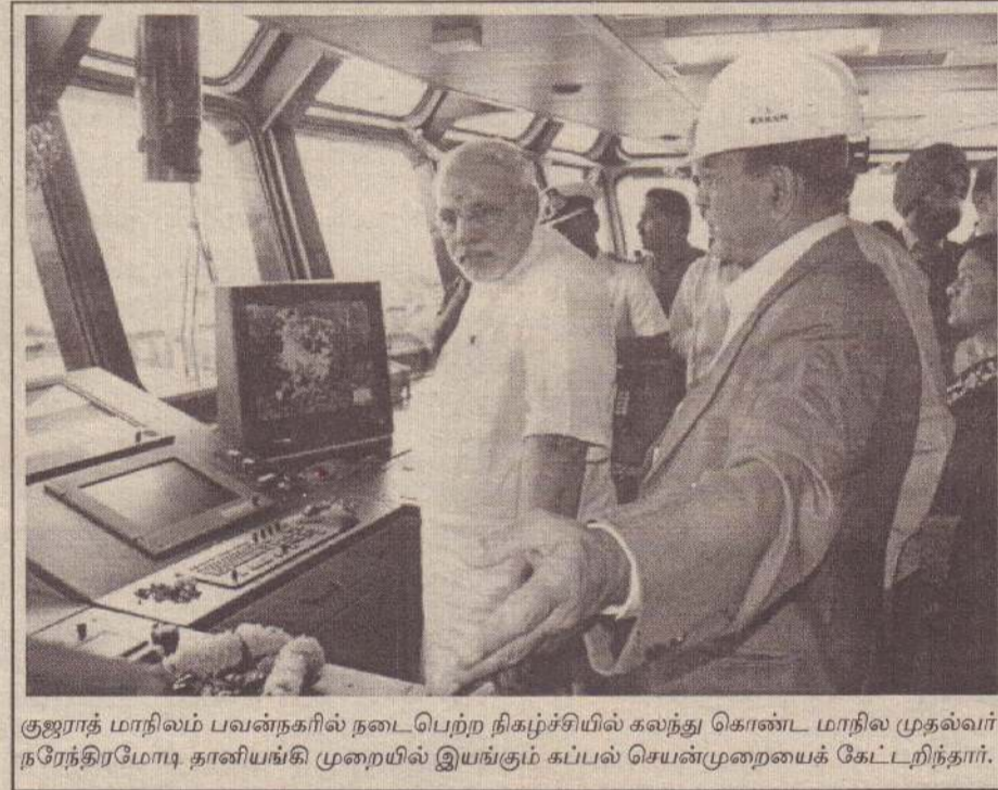
குஜராத் மாநிலம் பவன்நகரில் நடைபெற்ற நிகழ்ச்சியில் கலந்து கொண்ட மாநில முதல்வர் நரேந்திரமோடி தானியங்கி முறையில் இயங்கும் கப்பல் செயன்முறையைக் கேட்டறிந்தார்.

இதையடுத்து துணிச்சலோடு எழுந்து நின்ற ஒரு விவசாயி, நீங்கள் ஆட்சிக்கு வந்து விவசாயிகளுக்கு எதுவுமே செய்யவில்லை, நாம் கையில் பணம் இல்லாமல் திண்டாடுகிறோம். வெறும் வாக்குறுதிகளை மட்டும் கொடுத்தால் போதாது என்று தனது ஆதங்கத்தை வெளிப்படுத்தினார். இதனால் கோபமடைந்த மம்தா, அவரை மாவோயிஸ்ட் என்றும், தீவிரவாத அமைப்பைச் சேர்ந்தவர் என்றும் ஏசினார். இந்தநிலையில், முதலமைச்சரின் பொதுக் கூட்டத்தில் இடையூறு செய்த குற்றத்துக்காக அந்த விவசாயி நேற்றுமுன்தினம் இரவு கைது செய்யப்பட்டுள்ளார். (வ)