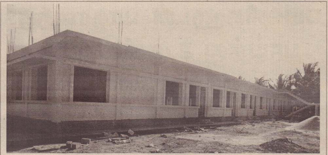
வட இலங்கை சங்கீத சபைக்கு கே.கே.எஸ் வீதியில் மருதனார் மடம் சந்திக்கு அப்பால் புதிய கட்டடம் ஒன்று அமைக்கப்பட்டு வருகிறது. (ம-17)

இந்த மேலதிக குடிதண்ணீர் விநியோகம் கடந்த வியாழக்கிழமை முதல் நடைமுறைப்படுத்தப்பட்டுள்ளதால் குடிதண்ணீருக்கு நிலவிய தட்டுப்பாடு ஓரளவு நீங்கியுள்ளது. (த-7-17-250)