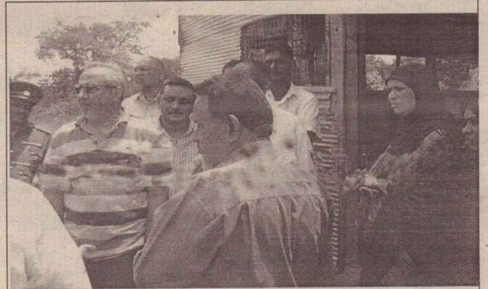
தீக்கிரையாக்கப்பட்ட பள்ளிவாசலை பார்வையிடும் அமைச்சர் ஹக்கீம்..

வைத்தியசாலை வெளிநோயாளர் பிரிவுக்கு குடிநீர் வடிகட்டி அண்மையில் நோயாளர் ஒருவரால் அன்பளிப்பாக வழங்கப்பட்டமை தெரிந்ததே. (3-9)