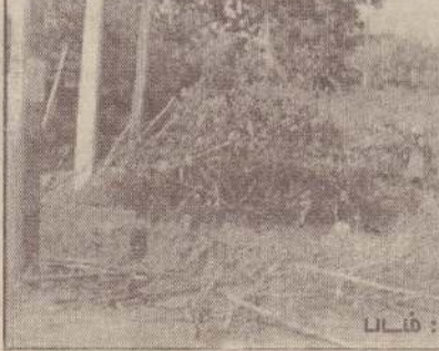
படம் : தேசன