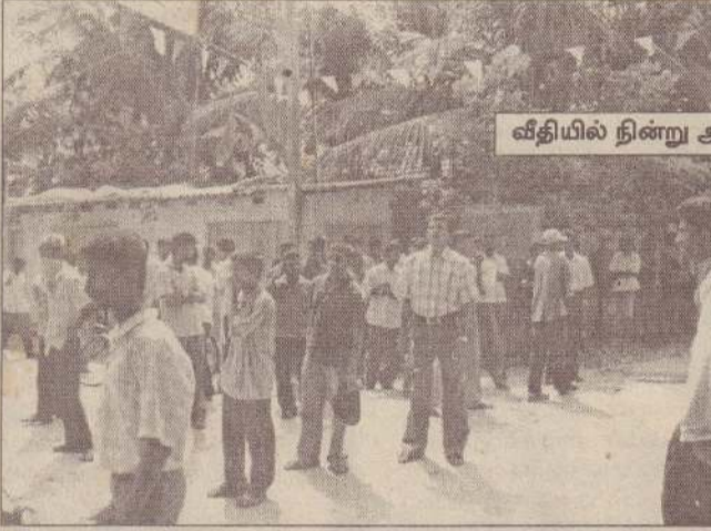
வீதியில் நின்று ஆக்ரோஷக் குரல்...