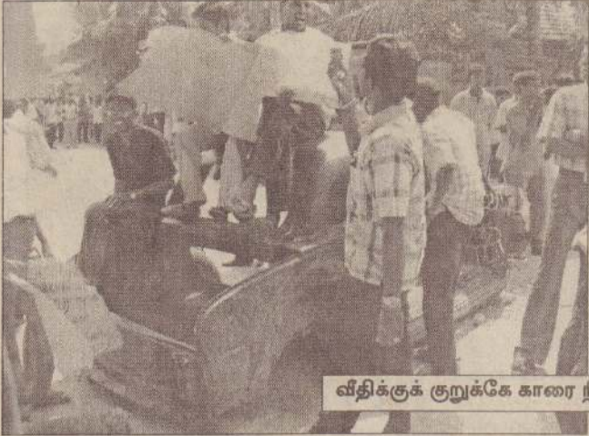
வீதிக்குக் குறுக்கே காரை நிறுத்தி வைத்து மறியல்...