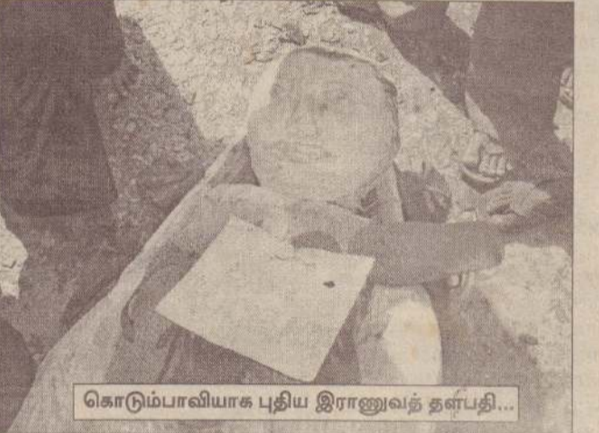
கொடும்பாவியாக புதிய இராணுவத் தளபதி...