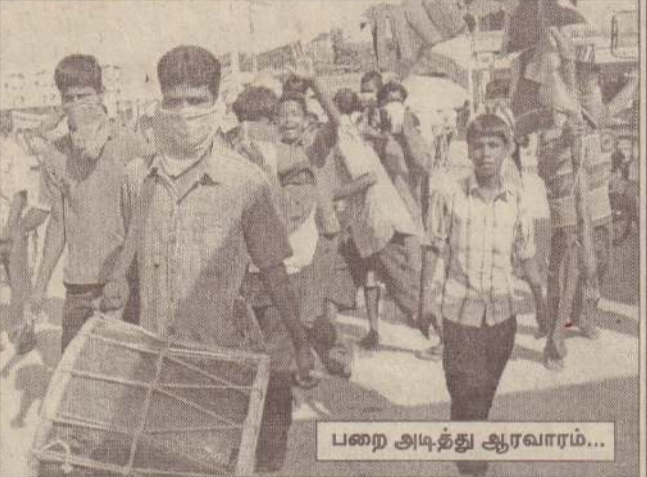
பறை அடித்து ஆரவாரம்...