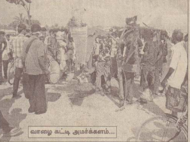
வாழை கட்டி அமார்க்களம்...