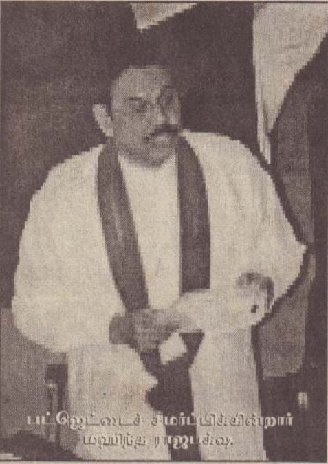
பட்ஜெட்டில் சமர்ப்பிக்கின்றார் மஹிந்த ராஜபக்ஷ.