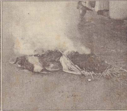
யாழ்.நகரப் பகுதியில் நேற்று ஜனாதிபதி மஹிந்த ராஜபக்ஷவின் கொடும்பாலி எரிக்கப்பட்டது. மாணவர்கள் கொடும்பாலியை பிரேத ஊர்வலம் போன்று எடுத்து வந்து மழைக்கு மத்தியில் வீதியில் தீக்கிரையாக்கினர். அப்போது எடுக்கப்பட்ட படங்கள்.