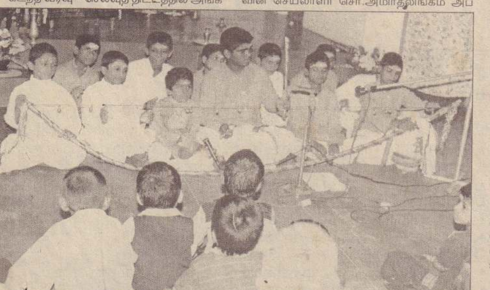
கோப்பாய் சக்திய சேவா நிலையத்தில் நடைபெற்ற பகவான் சூசக்திய சாய் பாய்வின் 80 ஆவது அவதார தினாழிற்விழையோடு கோப்பாய் சாய் சிறுவர் இல்ல மாணவர்கள் பகவானின் மகிமை என்னும் தலைப்பில் விவ்விசை நிகழ்த்தியபோது எடுக்கப்பட்ட படம். (ஐ-72)

கூடும் மழை பாதித்தோருக்கு சமையல் உபகரணங்கள் அண்மையில் பெய்த கடும் மழையினால் பாதிக்கப்பட்ட இருபாலை தெற்கு, இருபாலை கிழக்கு, புத்தூர் கிழக்கு ஆகிய கிராம அலுவலர் பிரிவுகளைச் சேர்ந்த மக்களுக்கு சமையல் உபகரணங்கள் வழங்கப்படவுள்ளன. இலங்கை செஞ்சிலுவைச் சங்கத்தின் கோப்பாய் கிளை மேற்படி சமையல் உபகரணங்களையும், வீட்டுப் பாவனைப்பொருள்களையும் வழங்கவுள்ளது என்றும் - நாளை மறுதினம் திங்கட்கிழமை காலை 10 மணிக்கு கோப்பாய் பிரதேச செயலகத்தில் வைத்து இவை வழங்கப்படும் என்றும் - அறிவிக்கப்பட்டுள்ளது. (எ-75)