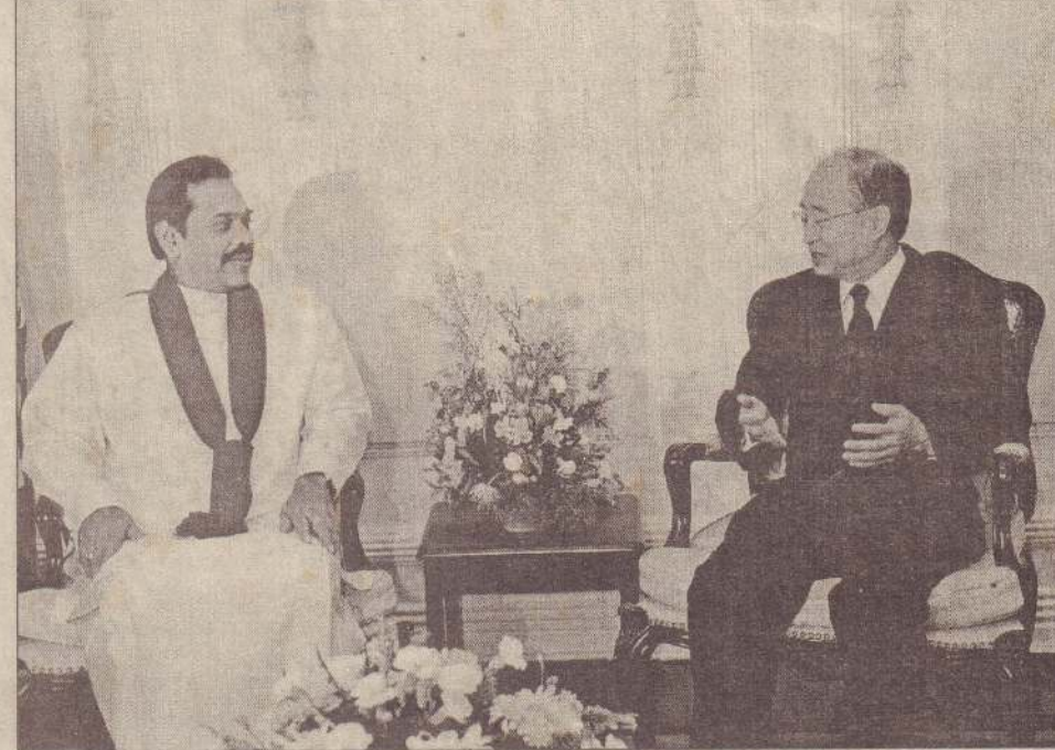
ஜப்பானின் விசேட தூதுவர் யசுஷி அகாஷி நேற்று அலரி மாளிகையில் ஜனாதிபதி மஹிந்த ராஜபக்ஷவைச் சந்தித்தபோது எடுக்கப்பட்ட படம்.

இலங்கை அமைதி முயற்சிகளுக்கான ஜப்பானிய விசேட பிரதிநிதி யசுஷி அகாஷி இன்று கிழக்கு மாகாணத்திற்கான விஜய மொன்றை மேற்கொள்ளவுள்ளார். கிழக்கில் தமிழ் மற்றும் முஸ்லிம் மக்களின் பிரதிநிதிகளைச் சந்திக்கவுள்ள அகாஷி அங்கு இடம்பெற்றவரும் வன்முறைகளைக் கட்டுப்படுத்துவது தொடர்பிலும் ஆராய்வா ரெனக் கொழும்பிலுள்ள ஜப்பானியத் தூதரக வட்டாரங்கள் தெரிவித்தன. முன்னதாக நேற்று கொழும்பில் ஜனாதிபதி மஹிந்த ராஜபக்ஷ, பிரதமர் ரட்ணசிறி விக்கிரமநாயக்க, வெளிவிவகார அமைச்சர் மங்கள சமரவீர ஆகியோரை அவர் தனித்தனியாகச் சந்தித்துப் பேச்சு நடத்தினார். இந்தச் சந்திப்புகளின் போது இலங்கையின் அமைதி முயற்சிகள் மற்றும் வடக்கு - கிழக்கில் தொடர்ந்து வரும் வன்முறைகள் ஆகியன குறித்து விரிவாக ஆராயப்பட்டிருப்பதாகக் கூறப்பட்டது. அமைதி முயற்சிகளை ஆரம்பிப்பதற்கான அழைப்பை விடுத்தமைக்காக ஜனாதிபதி மஹிந்தவிடம் தமது வரவேற்பை வெளியிட்ட யசுஷி அகாஷி, இலங்கை அமைதி முயற்சிகளுக்கு இணைத் தலைமை என்ற அந்தஸ்திவிருந்து ஜப்பான் முழுமையான ஒத்துழைப்பை வழங்குமென்றும் உறுதியாகத் தெரிவித்திருக்கிறார். தனது இலங்கைப் பயணத்தை முடித்துக் கொண்டு அகாஷி நாளை ஜப்பானுக்குத் திரும்புவாரெனத் தெரிவிக்கப்படுகிறது. (ஊ-க)