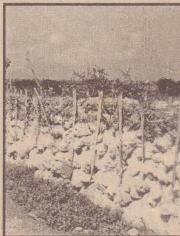
நெடுந்தீவுக்கே உரித்தான பிரத்தியேக கல் மதில் ஒன்று

யாழ்ப்பாண நகரில் இருந்து 20 'மைல்' தொலைவிலுள்ள குறிகாட்டுவான் துறைமுகத்திற்குப் புங்குடுதீவு ஊடாகச் சென்று, அங்கிருந்து 7 'மைல்' தொலைவிலுள்ள நெடுந்தீவு