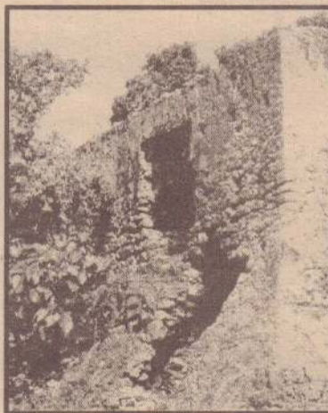
காலம் உருக்குலைத்த போதும், கம்பீரம் குலையாத மிகாமன் கோட்டை.

தீவின் வடபகுதி பனை, தென்னை அடர்த்தியாகவுள்ள இடமாகவும்; தென் பகுதி திறந்த புல் வெளியாகவும் (An open Pasture) உள்ளன. கேணிகள், கிணறுகள், குளங்கள்,