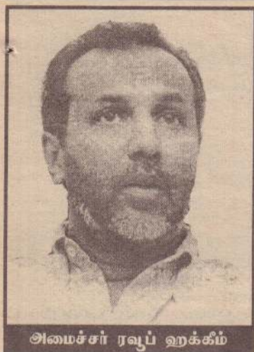
அமைச்சர் ரவீப் ஹக்கீம்