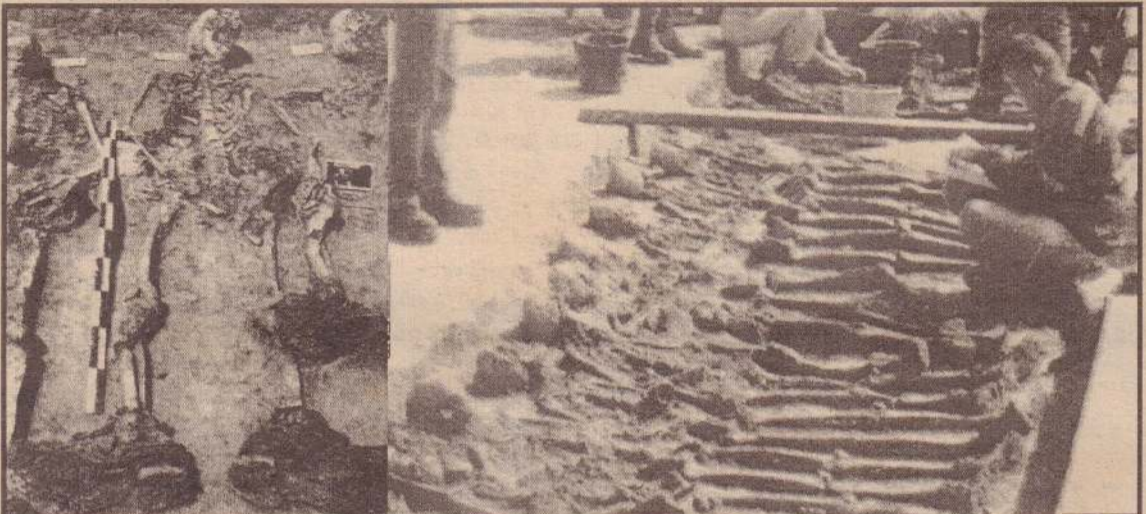
1914-18ஆம் ஆண்டுகளில் கிடம்பெற்ற முதலாம் உலகப் போரில் உயிரிழந்த பிரிட்டிஷ் போர் வீரர்கள் 24 பேரின் எலும்புகளும் பிரான்ஸின் அரான் நகரில் கண்டுபிடிக்கப்பட்டன. பி.எம்.டபிள்யூ.கார் நிறுவனத்தின் தொழில்சாலையின் கட்டுமானப் பணிகளின் போது தற்செயலாக கிடைத்த எலும்புகளும் கண்டுபிடிக்கப்பட்டன. கைகள் கோர்க்கப்பட்ட நிலையில் காணப்படும் கிடைத்த எலும்புகளும் கண்டனம் உடனடி சம்பாத்துகள் சீதைவடையாக உள்ளன. பொதுநலவாய போர்ப் புதை குழிகள் ஆணைக்குழு உறுப்பினர்கள், கண்டுபிடிக்கப்பட்ட எலும்புகளும் புதைகுழியிலிருந்து சீதையாமல் மீட்கும் பணியில் கவனத்துடன் ஈடுபட்டிருப்பதையும், எலும்புகளும் சிலவற்றையும் படங்களில் காணலாம்.

யுத்த நிறுத்தத்தை நிராகரித்த பலஸ்தீனத் தீவிரவாதிகள், இஸ்ரேலியர்கள் மீது தாக்குதல்களை மேற்கொண்டுவருவதும் - தெரிந்தவையே. (ஓ)