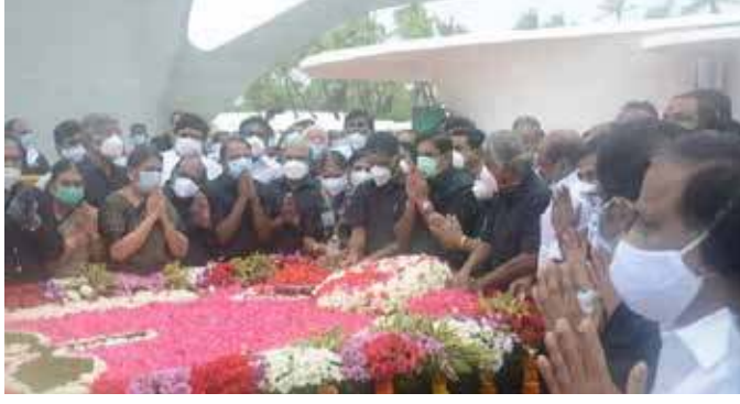
தமது இல்லங்களில் விளக்கு ஏற்றி வைத்து, அவரது

மேலும், அ.தி.மு.க. நிர்வாகிகளும் தொண்டர்களும்