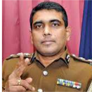
சிறைச்சாலையில் இடம்பெற்ற மோதலில் 11 கைதிகள் மரணித்துள்ளமையுடன் 108 பேர் காயமடைந்துள்ளமை குறிப்பிடத்தக்கது.