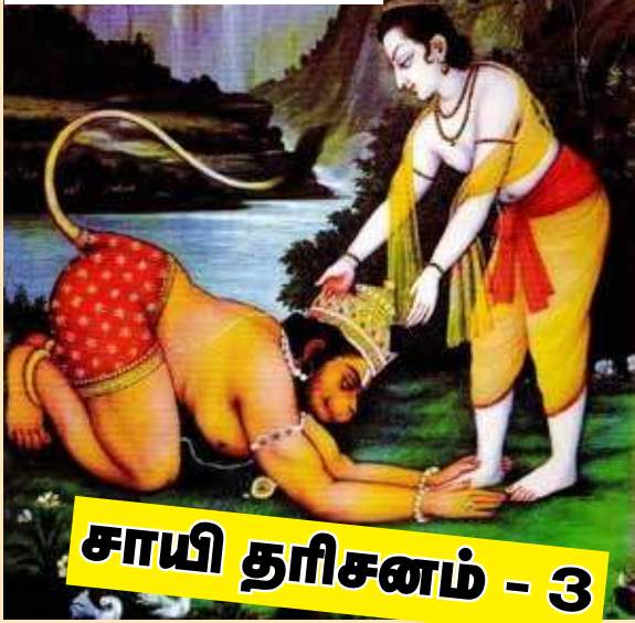
சாயி தரிசனம் - 3