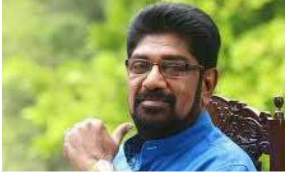
உள்ளடக்கப்படவில்லை. கல்வி தகைமையில்லாதவர்கள் தவறான வழியில் செல்கிறார்கள். இவர்களின் வாழ்க்கை தரத்தை மேம்

அவர் மேலும் குறிப்பிடுகையில்: - கல்வித் தகைமையில்லாதவர்கள் தவறான வழியில் ஒரு லட்சம் பேருக்கு தொழில் வாய்ப்புக்களை வழங்கும் திட்டம் அரசாங்கத்தின் 'சுபீட்சமான கொள்கை' திட்டத்தில்