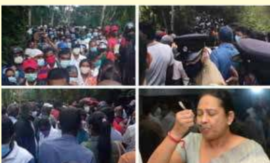
பது இன்னமும் விஞ்ஞான ரீதியாக நிரூபிக்கப்படவில்லை எனவும் சுட்டிக்காட்டியுள்ளார்.

பொதுமக்கள் மிகப்பெரிய ஆபத்தான நடவடிக்கையில் ஈடுபட்டுள்ளனர் எனக் குறிப்பிட்டுள்ள அவர், இந்த மருந்து கொரோனாவை குணப்படுத்தக்கூடியது