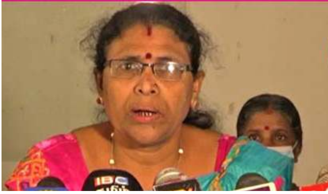
கடந்தகால உண்மை வரலாறு.

அந்த செய்தியை அடிப்படையாக வைத்தே, அடுத்தகட்ட நகர்வுகளுக்கான காய்கள் நகர்த்தப்பட்டன. அதுதான்