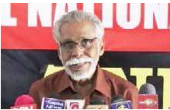
வருடகால நண்பர். அவரை விடுத்து சிறியை நான் சிபார்சு செய்வது நீண்டகால ஒற்றுமை கருதியும்

மேலும் மாவை போன்ற ஒரு முக்கிய கட்சியின் தலைவர் கூட்டுக்கும் தலைமை வகித்தால் சிறிய கட்சிகள் வலு இழந்துவிடுவன. முக்கிய கட்சியின் கையே ஓங்கும். அதன் செல்வாக்கே செல்லுபடியாகும். ஆனால் சிறிய கட்சியின் தலைவர்கள் கூட்டுக்குத் தலைமை வகித்தால் பெரிய கட்சிகளுக்கு எந்தப் பாதிப்பும் ஏற்படாது. சிறிய கட்சிகளும் அடையாளம் பெறுவன. மாவை எனது பல