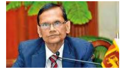
விடுத்துள்ள அறிக்கையில் தெரிவிக்கப்பட்டுள்ளது.

அத்துடன் அதற்கான அமைச்சரவை அனுமதியைப் பெற்றுக் கொள்வது தொடர்பிலும் கலந்துரையாடப்பட்டதாக கல்வி அமைச்சர்