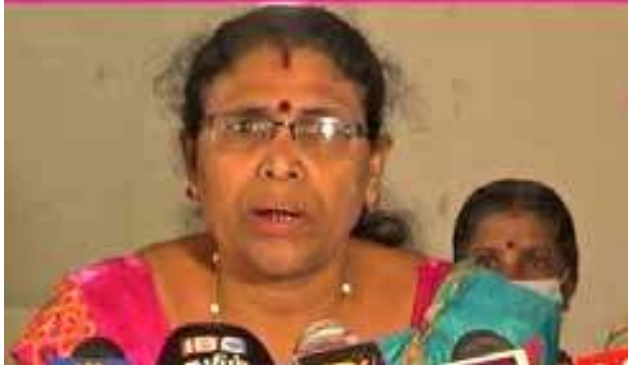
கடந்தகால உண்மை வரலாறு.

அந்த செய்தியை அடிப்படையாக வைத்தே, அடுத்தகட்ட நகர்வுகளுக்கான காய்கள் நகர்த்தப்பட்டன. அதுதான்