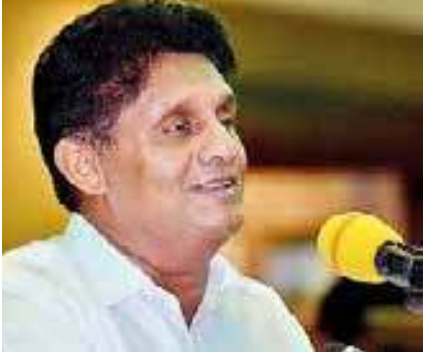
கொரோனா அச்சுறுத்தல் காரணமாக கொடும்பில் முடக்கப்பட்டுள்ள பகுதிகளில் வாழும் மக்களுக்கு 5 ஆயிரம்

எதிர்க்கட்சி தலைவர் சஜித் பிரேமதாஸ் வலியுறுத்தல்