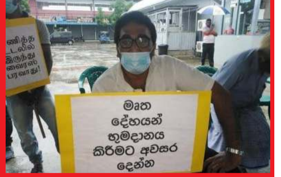
பொதுமக்களின் போக்குவரத்துக்கு இடையூறு ஏற்படுத்தாத வகையில் நேர காலத்தடன் போராட்டம் நிறைவுற்றது.

ஜனாஸாவை அடக்க அனுமதி தா, நல்லடக்கம் எங்கள் அடிப்படை உரிமை அதை மறுப்பது சர்வாதிகாரம், விஞ்ஞானத்தை ஏற்று கொள் இனவாதத்தை கை விடு, இனவாதிகள் அல்ல! நிபுணர்கள் சொல்வதை கேட்டு நட, இனவாதமாக இல்லாமல் விஞ்ஞானரீதியாக செயற்படு போன்ற வாசகங்கள் எழுதப்பட்ட பதாகைகளை போராட்டத்தில் ஈடுபட்டவர்கள் ஏந்தியிருந்தனர்.