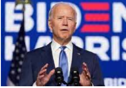
அமெரிக்காவில் பல்லாயிரக்கணக்கான மக்கள் கொரோனாவால் உயிரிழக்க நேரிடலாம் என ஜோ பைடன் எச்சரிக்கிறார்