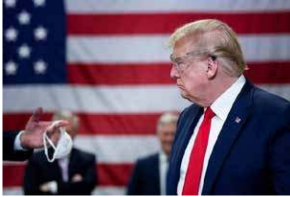
இதுமட்டுமன்றி, வரி ஏய்ப்பு வழக்கில் சிறைத் தண்டனை பெற்ற சார்லஸ் குஷனருக்கும் ட்ரம்ப் பொதுமன்னிப்பு அளித்துள்ளார். இவர் ட்ரம்ப் மகள் இவாங்காவின் மாமனார் என்பது குறிப்பிடத்தக்கது.

இதில் கடந்த 2016 ஆம் ஆண்டு நடைபெற்ற தேர்தலில் ரஷ்யா தலையீடு செய்ததாகக் கூறப்படும் வழக்கில் சிறைத் தண்டனை விதிக்கப்பட்ட பால் மானாஃ போர்ட்டுக்கு பொதுமன்னிப்பு வழங்கப்பட்டுள்ளது. மேலும், இந்த வழக்கில் குற்றவாளியாக அறிவிக்கப்பட்ட ரோஜர் ஸ்டோனுக்கும் நிபந்தனையற்ற பொதுமன்னிப்பு வழங்கப்பட்டுள்ளது.