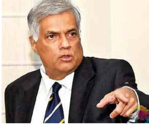
பிரதமர் மீண்டும் குழு நியமித்துள்ளார். அதுவரையிலும் சடலங்களைப் பாரிய குளிர்நட்டியில் வைப்பதற்கு ஏற்பாடுகள் செய்யப்பட்டுள்ளன. இவ்வாறான குளிர்நட்டிகளில் வைரஸ் தொற்று அற்ற சடலங்களை வைப்பதும் பின்னர் வைரஸ் தொற்றால்

கொரோனா வைரஸ் தொற்றால் உயிரிழக்கும் முஸ்லிம்களின் ஜனாஸாக்கள் தொடர்பில் பாரிய பிரச்சினைகள் எழுந்துள்ளன. எரிப்பதா? புதைப்பதா? என்று ஆராய