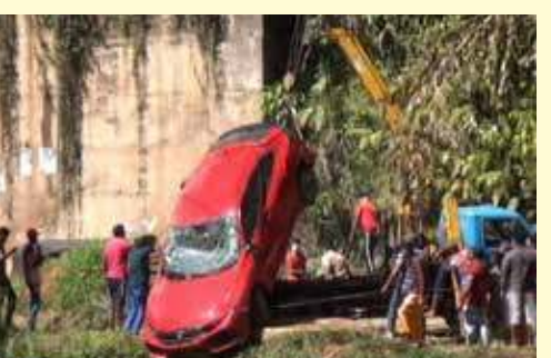
கார் பலத்த சேதமடைந்துள்ளமை குறிப்பிடத்தக்கது.

தெனியாய பிரதேசத்தில் கடந்த திங்கட்கிழமை இரவு 10.30 மணியளவில் வைத்தியர் சென்ற கார் 80 அடிக்கு மேற்பட்ட பள்ளத்தில் வீழ்ந்து விபத்துக்குள்ளாகியது.