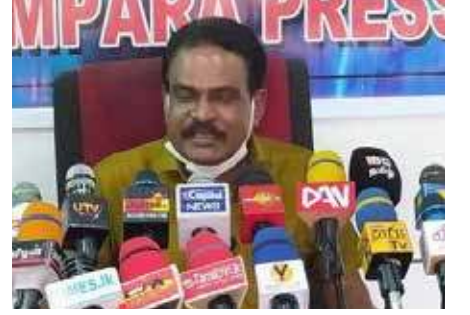
தீர்வுதான் இல்லாமல் போய் கொண்டு இருக்கின்றது. அரசாங்கம் இவற்றை கருத்தில் கொண்டு கவனமாக செயற்பட வேண்டும். - என அவர் குறிப்பிட்டுள்ளார்.