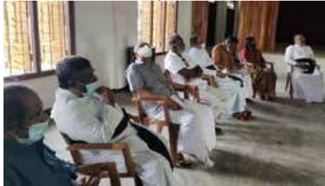
வலிந்து காணாமலாக்கப்பட்டோர் விடயங்கள் தொடர்பான கடந்த கால செயற்பாடுகள் மற்றும் எதிர்

காலத்தில் முன்னெடுக்கப்பட்ட வுள்ள செயற்பாடுகள் தொடர்பில் விசேட கலந்துரையாடல் கிளிநொச்சியில் நடைபெற்றது.