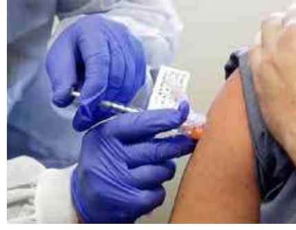
அலைபேசியில் பதிவிறக்கிக் கொள்ளலாம். இந்த சான்றுடன் வருவோரை பொது இடங்கள், பொழுதுபோக்கு கூடங்கள், தீரையாங்குகள், தொழிற்சாலைகள் ஆகியவற்றில் அனுமதிக்க பல நாடுகள்

பிரிட்டன், ரஷ்யா ஆகியவை மக்களுக்கு கொரோனா தடுப்பூசி போட்டு வருகின்றன. இதையடுத்து தடுப்பூசி போட்டுக் கொண்டவர்களுக்காக பல நிறுவனங்கள் 'தடுப்பூசி பாஸ்போர்ட்' என்ற சான்றிதழ்களை வழங்க உள்ளன. இந்தவகையில் 'கொமன் டிரஸ்ட் நெட் ஒர்க்' என்ற நிறுவனம் 'கொமன்பாஸ் ஒல்' என்ற அலைபேசி செயலியை உருவாக்கியுள்ளது. கொரோனாவால் பாதிக்கப்பட்டு குணமடைந்தோர் மற்றும் தடுப்பூசி போட்டுக் கொண்டவர்கள் இந்த செயலியில் தங்கள் சிகிச்சை விவரங்களை அளிக்கலாம் அவர்களுக்கு 'கியூஆர் கோடு' தொழில்நுட்பத்தில் 'தடுப்பூசி பாஸ்போர்ட்' என்ற சான்றிதழ் வழங்கப்படும். அதை