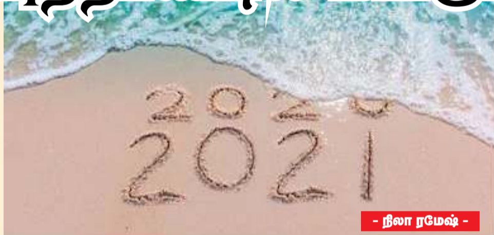
- நிலா ரமேஷ் -

இப்படி எந்தப் பக்கம் திரும்பினாலும் அடி இந்த ஆண்டு ஏன் இவ்வளவு எதிர்மறையாக இருக்க வேண்டும் என்பதும் 2021 ஆம் ஆண்டும் இவ்வாறு அமைந்துவிடுமோ என்பதுதான் இப்போது எல்லோரின் கவலையாக இருக்கிறது.