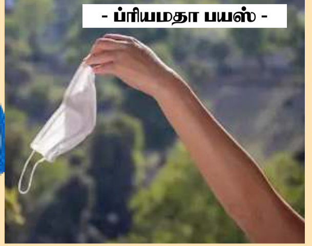
- ப்ரியமதா பயஸ் -

உலகத்தில் விஞ்ஞானத்தின் உச்சக்கட்ட வளர்ச்சி, மனிதனை யாரும் ஆட்டிப் படைக்க முடியாது என்று மனிதன் கொண்ட கர்வம், உலகப்பந்தை ஆள்வது மனித சமூகமே என்ற தீமிர், அண்டவெளியொங்கும் நாமே ஆள்வோம் என்ற பெரும் எதிர்பார்ப்பு, அத்தனை கோள்களையும் நம்கைக்குள் அடக்குவோம் என்று மனிதன் கண்ட கனவு எல்லாவற்றையும் அடங்க வைத்து, இன்று பூகோள சாஸ்திரங்களையும், சனிப் பெயர்ச்சியையும் முன்னோர்கள் கணித்த எதிர்வுகூறல்கள் எல்லாவற்றையும் புரட்டி புரட்டி பார்க்க வைத்த ஆண்டாக 2020 மாறியது - மனித குல வரலாற்றில் யாராலும் மறக்க முடியாத ஆண்டாகி விட்டு எந்த சலனமும் இன்றி புறப்பட்டு போகப்போகிறது 2020 ஆம் ஆண்டு .