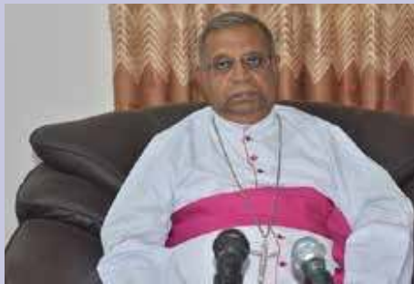
திருவிழாவை நாங்கள் மகிழ்ச்சியுடன் கொண்டாட வேண்டும்.