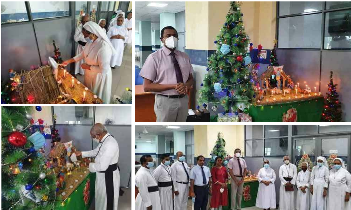
யாழ், போதனா வைத்தியசாலை கண் சத்திரசிகிச்சை விடுதியில் கிறிஸ்மஸ் விழா இன்று கொண்டாடப்பட்டது.