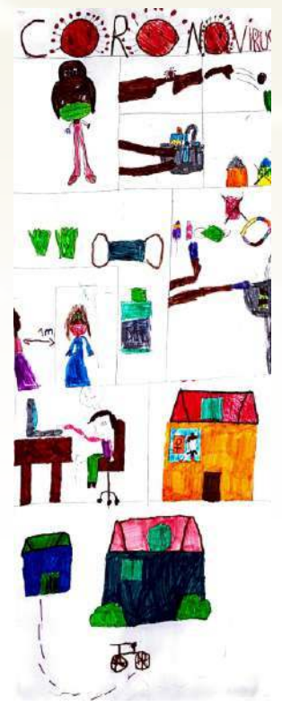
சகீந்திரராஜன் ட்ரோஸ்யிக் Gel, பீராக்கஸ்