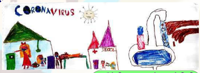
சகீந்திரராஜன் யஸ்யிக் Gel, பீராக்கஸ்