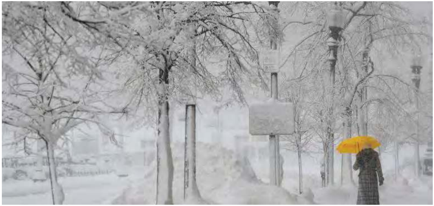
அமெரிக்காவில் தற்போது கடும் பனிப்பொழிவு நிலவுகின்றது. அந்த நாட்டின் பல மாநிலங்களில் இயல்பு வாழ்க்கை பாதிக்கப்பட்டுள்ளது. (ம)