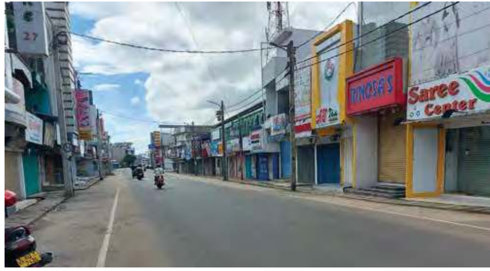
கொரோனா பரவலைக் கட்டுப்பாட்டுக்குள் கொண்டு வருவதற்காக நேற்று முதல் கல்முனை நகர் முடக்கப்பட்டது. இதனால் இன்று கல்முனை நகர், கல்முனைச் சந்தை மற்றும் வீதிகள் வெறிச்சோடியுள்ளன. (ற-இ)