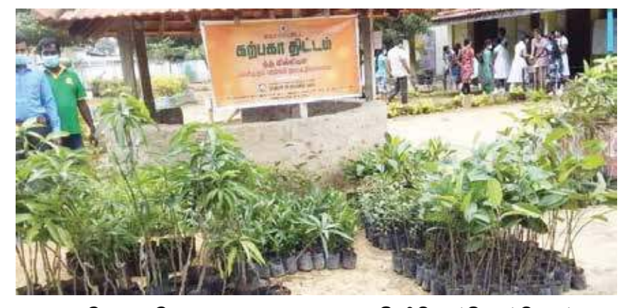
கற்பகா திட்டத்தின் 27 ஆவது கட்டமாக, கிளிநொச்சி முக்கொம்பன் மகா வித்தியாலய மாணவர்களுக்கு, பழமரக்கன்றுகள் வழங்கப்பட்டன. அத்துடன் பாடசாலைச் சூழலில் மரக்கன்றுகளும் நடப்பட்டன. (க-222)