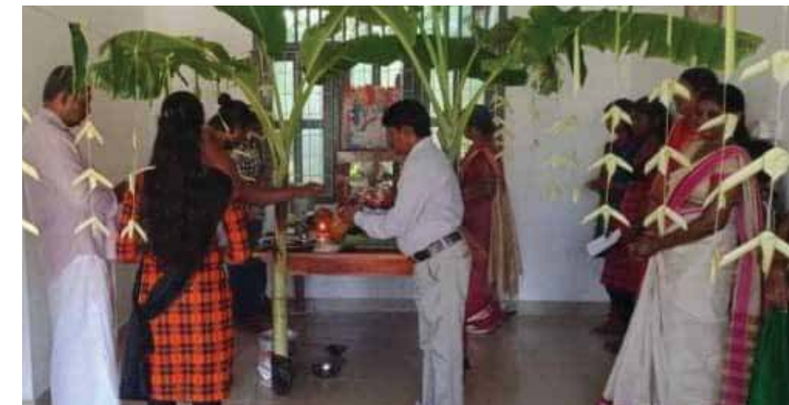
கிளிநொச்சி இந்துக் கல்லூரியில், நவராத்திரிப் பூசை கும்பவைப்பு வழிபாடுகள் நேற்று முன்தினம் சனிக்கிழமை இடம்பெற்றன. (க-159)

அனுமதிப்பத்திரம் இன்றி ஏற்றிச் செல்லப்பட்ட 35 மரக்குற்றிகள், பளைப் பொலிஸாரால் கைப்பற்றப்பட்டன. பளை பொலிஸ் பிரிவுக்குட்பட்ட தர்மகேணியில் அனுமதிப்பத்திரம் இன்றி வேம்பு மற்றும் நாவல் மரங்கள் தறிக்கப்பட்டு, உழவியந்திரத்தில் ஏற்றிச் செல்லப்படுகின்றன என்று பொலிஸாருக்குத் தகவல் வழங்கப்பட்டது. அங்கு விரைந்த பொலிஸார் மரக்குற்றிகளுடன் உழவியந்திரத்தையும் கைப்பற்றினர். மரக்குற்றிகளை ஏற்றியவர்கள் வாகனத்தைக் கைவிட்டு தப்பிச் சென்றுள்ளனர். வாகனம் பொலிஸ் நிலையத்துக்கு எடுத்துச் செல்லப்பட்டது. மேலதிக விசாரணைகளை பொலிஸார் மேற்கொண்டு வருகின்றனர். (க-6)