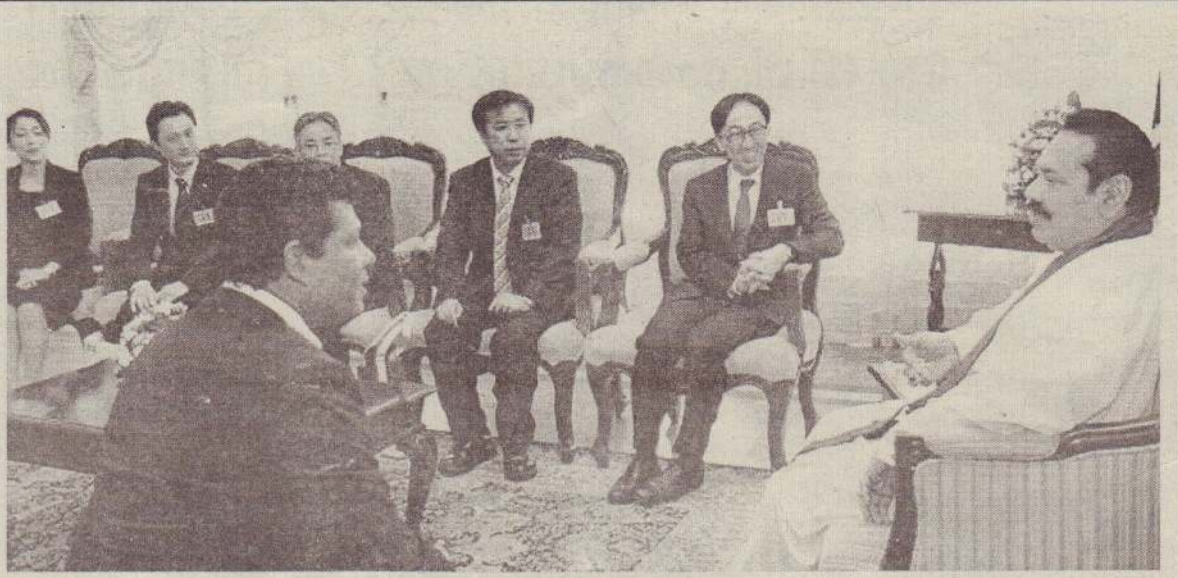
ஓய்வகத் தொழில் மற்றும் ஆராய்ச்சியாளர்கள் பிரதிநிதிகளை உள்ளடக்கிய ஜெப் மானியத் துறைக்குழு, ஜனாதிபதி மன்றத்தின் மூலம் அமைக்கப்பட்டது. அலரி மாணிகையில் சந்தித்து உரையாடியது.