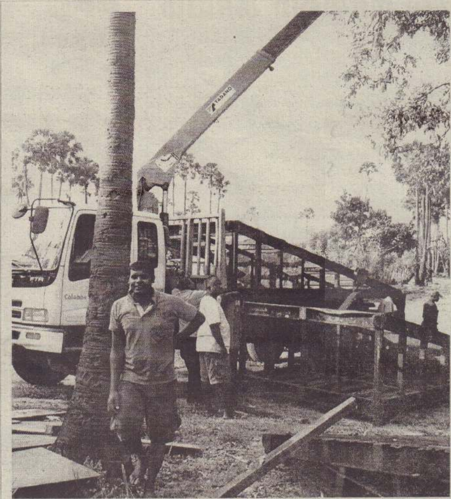
கடந்த இரண்டு வருடங்களுக்குமேலாகக் குறிகாட்டுவான் பகுதியில் சுவைப்பாளிற்றிக் கடந்த பாதை தற்போது திருத்தியமைக்கப்பட்டு வருகிறது. இந்தப் பாதை குறிகாட்டுவான், நயினாதிவு இடையே எதிர்வரும் ஜூன் மாதம் ஆரம்பமாகவுள்ள நயினை நாகபூசணி அம்மன் உற்சவத்தின்போது சேவையில் ஈடுபடலாம் என எதிர்பார்க்கப்படுகிறது. (த-7)

வேளை மக்களின் அவலங்களை வெளிப்படுத்தும் ஒரே ஒரு பத்திரிகையான 'உதயன்' பத்திரிகை தாக்கப்பட்டமையை வன்மையாகக் கண்டிக்கிறோம். அத்துடன் ஜனநாயக குழலில் இவ்வாறான சம்பவங்கள் ஊடாக கருத்துச் சுதந்திரத்தை நசுக்க முயல்வது எவராலும் ஏற்றுக்கொள்ளப்பட முடியாதது என்று நல்லூர் பிரதேச சபை நிறைவேற்றிய தீர்மானத்தில் தெரிவிக்கப்பட்டுள்ளது. (த-17)