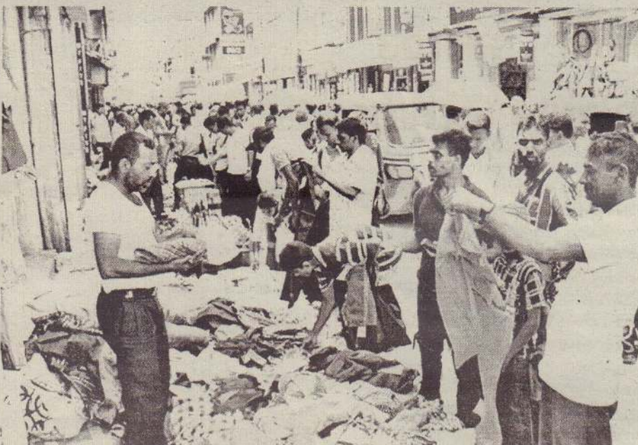
கொழும்பு, புறக்கோட்டையில் களைகட்டும் புத்தாண்டு வியாபாரம்.