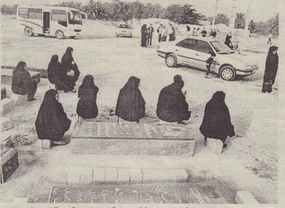
ஈராலைத் தாக்கிய நிலநடுக்கத்தில் உயிரிழந்தவர்களின் எண்ணிக்கை 37 ஆக உயர்ந்துள்ளது. 850 இக்கும் மேற்பட்டவர்கள் காயங்களுக்கு உள்ளாகி மருத்துவமனையில் அனுமதிக்கப்பட்டுள்ளனர். நிலநடுக்கத்தால் பெருமளவு கட்டிடங்கள் இடிந்து வீழ்ந்துள்ளன. மீட்டிப்புப் பணிகள் இன்னும் தொடர்ந்து நடைபெற்று வருகின்றன என்று கூறப்படுகிறது.

நாடுகளையும் பாதுகாத்துக் கொள்ளும் திறன் எமக்கு உண்டு. எந்தச் சவாலையும் எதிர்கொள்ள தயாராக உள்ளோம். வடகொரியா அரசு மற்றும் அதன் ஜனாதிபதி கிம் ஜோங் உன்னின் செயற்பாடுகளை கணிக்க முடியவில்லை"- என்று தெரிவித்தார்.