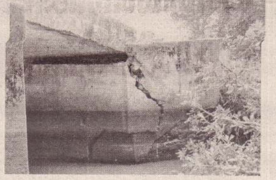
பிரதேச செயலகம் விரைந்து நடவடிக்கை எடுக்க வேண்டும் - என்றனர் (ப-112)

தில் ஆபத்துகள் காணப்படுகின்றன. கோட்டைகட்டியுள்ள மற்றும் அம்பலப்பெருமாள் குளம் ஆகிய கிராமங்களுக்கு போக்குவரத்துச் செய்வதற்கு இந்தப் பாலம் முக்கியத்துவமானது. பாலம் உடையுமானால் துணுக்காயில் இருந்து அக்கரையன் வரையான போக்குவரத்துகள் துண்டிக்கப்படும். எனவே குறித்த பாலத்தைச் சீரமைப்பதற்கு துணுக்காய்