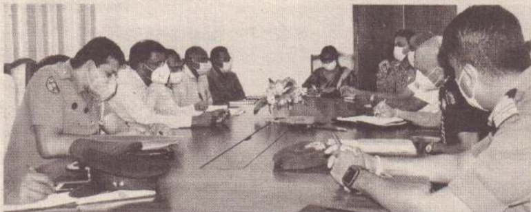
கொவிட் - 19 வைரஸ் பரவல் ஏற்படாத வகையில் முன்னெடுக்கப்பட வேண்டிய விடயங்கள் தொடர்பாக மன்னார் மாவட்டச் செயலகத்தில் நேற்று முன்தினம் கலந்துரையாடல் ஒன்று இடம்பெற்றது. இதில் சுகாதார திணைக்கள அதிகாரிகள் மற்றும் முப்படையினர் கலந்து கொண்டனர். (ப)

இடம்பெற்ற சஹ்ரானின் தாக்குதல் எல்லாம் கரும் புள்ளிகளாக அமைந்தன. சமூகத்தை ஓரங்கட்டி இதற்குத் தீர்வு காண்பது என்பது தவறான வழியைத் தான் காட்டும். ஒருவருக்கொருவர் மோதிக் கொண்டு தொடர்ந்து பிரிந்திருப்பதா அல்லது ஒன்றிணைந்து முன்னேறிச் செல்வதா என்பது குறித்து சிந்திக்க வேண்டும் - என்றார். (ப)