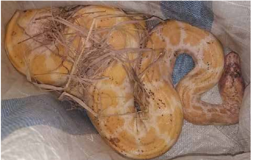
கலென்பிந்து நுவேவா ரித்திகல வனப் பகுதியில் ஒரு அரிய வகை மலைப்பாம்பொன்று கண்டுபிடிக்கப்பட்டுள்ளது. இப் பாம்பு தற்போது பாதுகாப்பில் வைக்கப்பட்டுள்ளது என வன ஜீவராசிகள் பாதுகாப்பு திணைக்கள அதிகாரிகள் கூறியுள்ளனர். (ந-இ)

கொழும்பு, ஒக்.25 களுபோவில மருத்துவமனையில் 6 ஊழியர்களுக்கு கொரோனாத் தொற்று உறுதிப்படுத்தப்பட்டுள்ளது. அதனையடுத்து மருத்துவமனையின் அவசர விபத்துப் பிரிவு, 23 மற்றும் 7 ஆவது விடுதிகள், வெளிநோயாளர் பிரிவு என்பன தற்காலிகமாக மூடப்பட்டன. அவை கிருமித் தொற்று நீக்கம் செய்யப்பட்ட பின்னர் மீண்டும் திறக்கப்பட்டுள்ளன என்று களுபோவில மருத்துவமனைப் பணிப்பாளர் தெரிவித்துள்ளார். (க-இ)