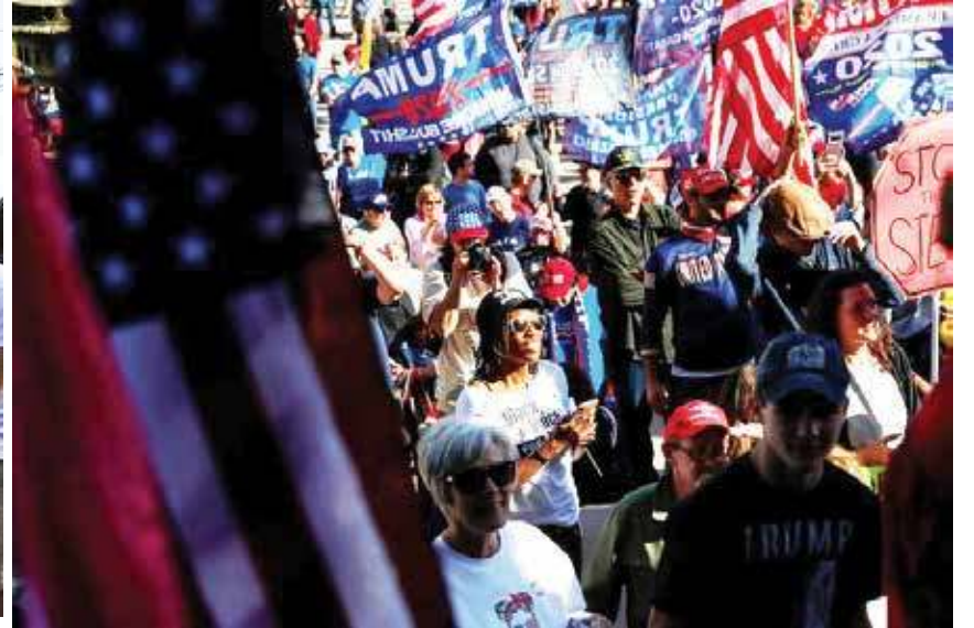
அரிஷோனாவில் வாக்கு எண்ணிக்கையில் மோசடி நடந்துள்ளது எனத் தெரிவித்து டொனால்ட் ட்ரம்பின் ஆதரவாளர்கள் தொடர்ந்தும் போராட்டத்தில் ஈடுபட்டு வருகின்றனர். இதனால் அங்கு பதற்ற நிலை தொடர்கிறது.